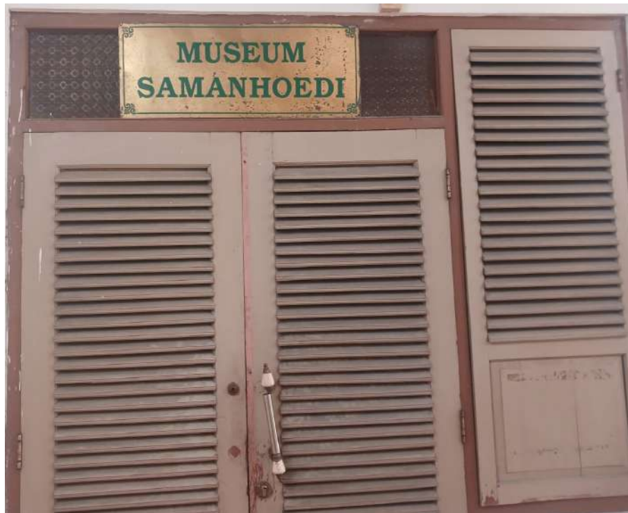
Gambar 5. Tampak depan Museum Samanudi

Yayasan Warna Warni Indonesia. Pendirian museum ini terinspirasi oleh buku Zaman Bergerak karya Takashi Shiraishi yang mengulas peran batik dan Sarekat Islam dalam sejarah Indonesia (Rusmiyati, 2018: 478). Berikut tampak depan dari museum samanudi.