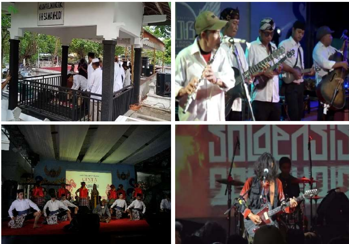
Gambar 4. Dokumentasi Foto-Foto NBS Tahun 2024 yang menampilkan Ziarah Makam K.H. Samanhudi, Pertunjukan Ketoprak, Pertunjukan Musik Climent dan Musik Rock

menghasilkan pertunjukan ketoprak modern berjudul Cinta Dua Juragan Batik , yang menggabungkan nilai sejarah dengan narasi fiksi populer untuk menarik minat generasi muda (wawancara Wiratmo, Februari 2025). Transformasi NBS dari kegiatan tradisional ke pendekatan yang lebih modern menunjukkan adaptasi budaya yang tetap mempertahankan esensi sejarah (wawancara Adinda, Februari 2025). Dokumentasi kegiatan NBS tahun 2024 dapat dilihat melalui gambar 4.