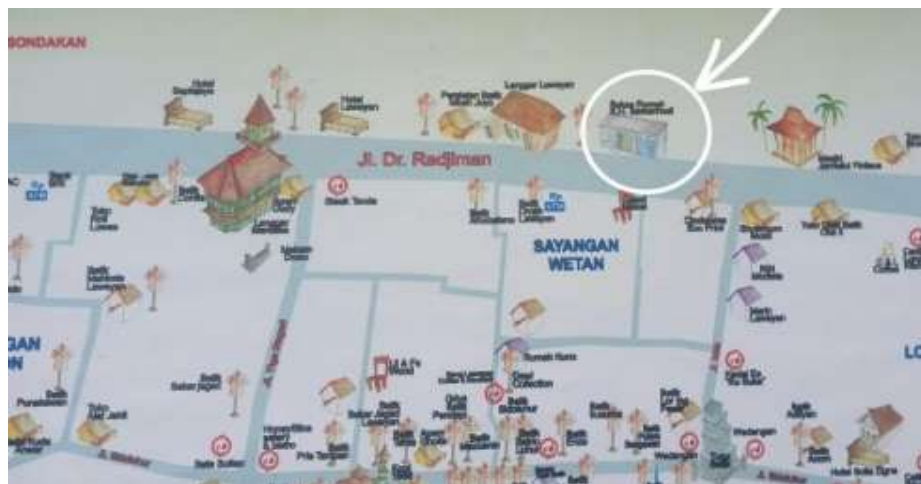
Gambar 3. Rumah Bekas K.H. Samanhudi dalam Peta Wisata Kelurahan Laweyan