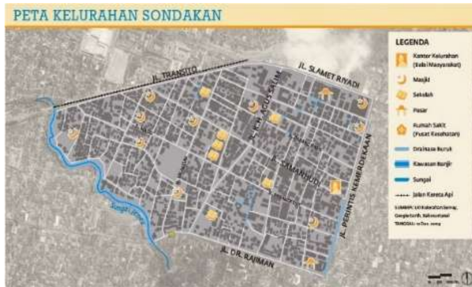
Gambar 1. Peta Kelurahan Sondakan

Stasiun Kereta Api Purwosari mendukung perkembangan ekonomi lokal. Kondisi tersebut dapat dilihat melalui peta pada gambar 1.