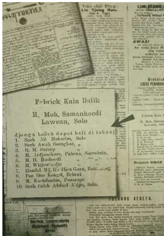
Gambar 2. Koran