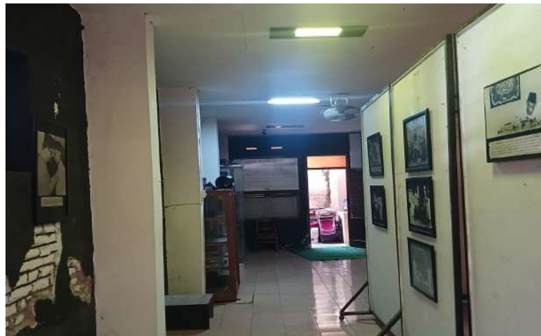
Gambar 6. Tampak dalam museum Samanhudi

Museum K.H. Samanhudi cenderung sepi pengunjung, sehingga interaksi masyarakat dengan warisan sejarah tokoh lokal ini relatif terbatas. Sebagian besar pengunjung terdiri dari pelajar dan mahasiswa yang datang terutama dalam rangka mengerjakan tugas akademik atau kegiatan studi. Sementara itu, kunjungan dari masyarakat umum relatif jarang terjadi, dan apabila ada, biasanya dilakukan dalam bentuk rombongan yang terorganisir, misalnya kunjungan dari lembaga pendidikan atau komunitas tertentu (Observasi, Februari 2025). Kondisi tersebut dapat dilihat melalui gambar berikut.