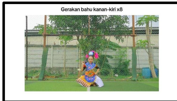
Gambar 1. Cuplikan gerak tutorial 1-4 video ke-1

memahami gerakan tari dengan lebih jelas dan meningkatkan keterampilan mereka dalam menari secara efektif.