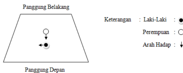
Gambar 4. Pola lantai bagian awal Sumber: Abdul Malik Siregar, 6 Juni 2025

Pada bagian awal tari, penari perempuan ditempatkan pada posisi yang lebih tinggi dan dominan.