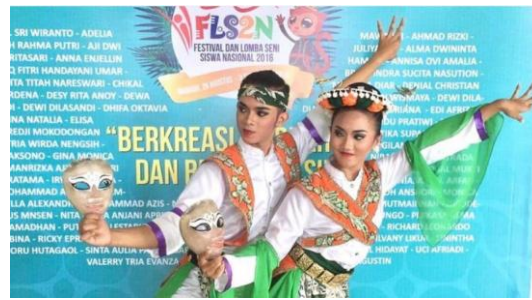
Gambar 7. Busana penari Tari Ambreg