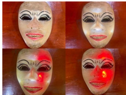
Gambar 9. Topeng Tari Ambreg

Topeng merupakan properti utama, dengan tiga warna (putih, merah muda, merah) dan dilengkapi lampu. Topeng dirancang bersama Mas Danang untuk menyampaikan emosi dan simbolisme. Topeng menjadi bagian penting dalam komunikasi visual. Berikut merupakan dokumentasi visual topeng Tari Ambreg .