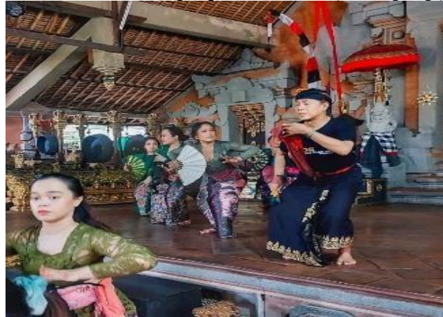
Gambar 2. Pelatihan Langsung ke Desa Peliatan (Balerung Stage)