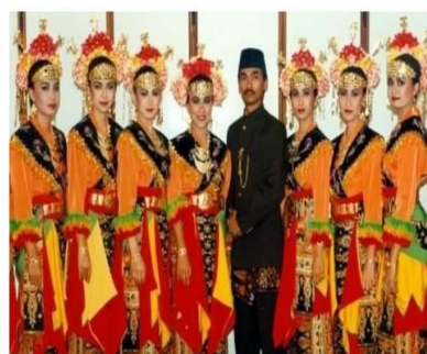
Gambar 3. Kostum Tari Gitek Balen Festival Film Asia 1994

Kostum Tari Gitek Balen memiliki ciri khas seperti kebaya Topeng, kain sarung tumpal, toka-toka, dan ampok (Gambar 4 menampilkan Kebaya Topeng, Kain Sarung Tumpal, Toka-Toka, dan Ampok ).