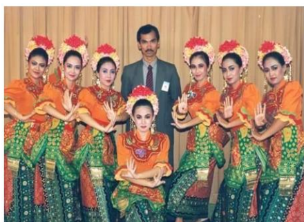
Gambar 2. Kostum Tari Gitek Balen Festival Film Asia 1993

Iringan musik tari Gitek Balen merupakan hasil pengembangan dari musik Topeng Betawi. Kostum tari Gitek Balen merupakan hasil pengembangan kostum Tari Topeng Betawi yang sudah pernah ada.