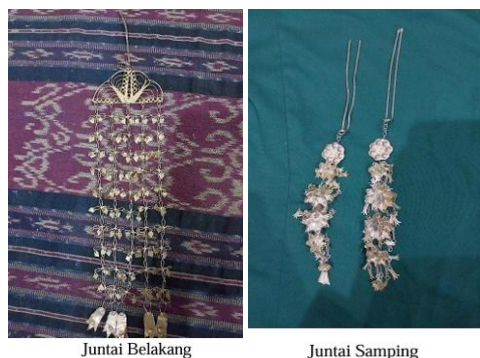
Gambar 6. Aksesori & Hiasan Kepala Tari Gitek Balen

Pendekatan semiotika Ferdinand de Saussure menunjukkan bahwa setiap elemen tari ini dapat dibaca sebagai sistem tanda, di mana penanda (gerak, musik, kostum) berhubungan erat dengan petanda (nilai-nilai kultural, sejarah interaksi sosial, dan identitas kolektif). Hubungan tersebut membentuk narasi budaya yang tidak hanya bersifat estetis, tetapi juga berfungsi sebagai media komunikasi lintas generasi.