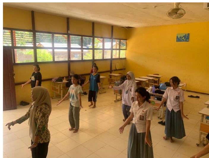
Gambar 2. Peserta didik melaksanakan kegiatan praktek Tari Tradisional

Dalam konteks pendidikan abad ke-21 pembelajaran tari tradisional dapat diintegrasikan dengan prinsip literasi seni yaitu mengenal, mempelajari, memahami, dan