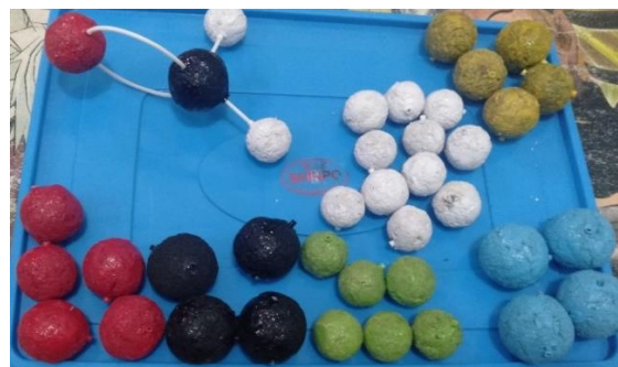
Gambar 2 Model molekul yang terbuat dari limbah styrofoam