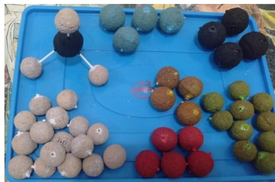
Gambar 1 Model molekul yang terbuat dari limbah serbuk gergaji

telah dibuatnya berdasarkan kriteria yang ditentukan. Secara keseluruhan tahap ini didapatkan nilai rata-rata sebesar 73 termasuk kedalam level 3 dengan kategori baik, artinya mahasiswa mampu memeriksa atau menilai kualitas produk masing-masing kelompok sesuai kriteria yang telah ditentukan meskipun tidak disertai dengan alasan yang tepat. Setiap kelompok memeriksa dan menilai kekurangan dan kelebihan produknya masing-masing kelompok dengan rinci dan disertai alasan yang relevan.