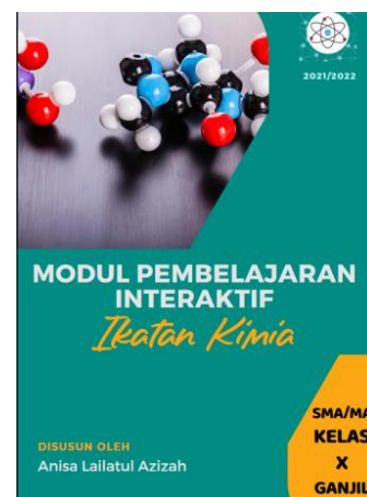
Gambar 1 Cover E-Modul

Tahap pengembangan ini merupakan tahapan E-Modul sudah selesai dikembangkan dari rancangan awal yang telah divalidasi. Saran perbaikan dari validator dijadikan pedoman dalam perbaikan yang selanjutnya menjadi produk final.