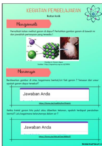
Gambar 2 Kegiatan Pembelajaran sesuai sintaks 5M