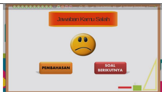
Gambar 10 Tampilan halaman total score