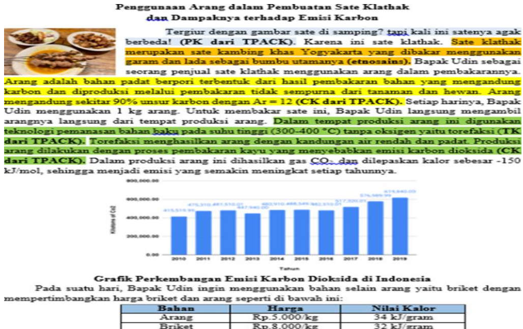
Gambar 3. Contoh Stimulus AKM Berbasis Pendekatan TPACK dan Etnosains

Butir soal nomor 19 berbentuk uraian yang mengukur kemampuan siswa dalam menerapkan hubungan matematis antara emisi karbon dioksida dan jumlah arang yang dibakar. Proses ini mencerminkan penerapan konsep rasio secara kontekstual, sehingga soal ini berada pada level kognitif C3 (applying). Bentuk uraian sangat tepat digunakan karena mendorong siswa menunjukkan langkah-langkah logis dan perhitungan sistematis, serta mencerminkan keterampilan literasi numerasi dalam konteks personal dan kehidupan nyata. Berdasarkan hasil pengerjaan dan wawancara, siswa dengan kemampuan literasi numerasi mahir pada level pemahaman (knowing) sudah mampu memahami dan menafsirkan informasi eksplisit dan implisit dari teks serta menggunakan data yang tersedia untuk melakukan perhitungan perubahan entalpi dengan benar. Pada level penerapan (applying) siswa sudah mampu menerapkan konsep perhitungan termokimia untuk menghitung entalpi dan nilai kalor. Pada level penalaran (reasoning) siswa sudah mampu menalar dalam memberikan argumen matematis yang sesuai untuk memecahkan masalah.