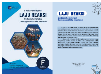
Gambar 1. Sampul depan dan sampul belakang

Penelitian ini menghasilkan produk e-modul pembelajaran kimia berjudul “ E-modul Pembelajaran Laju Reaksi Berbasis Kontekstual Terintegrasi Nilai-Nilai Keislaman ”. Sampul depan dan belakang e-modul disajikan pada Gambar 1.