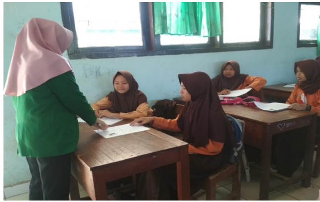
Gambar 1. Peneliti Membagikan Kartu Yang Berisi Soal dan Jawaban