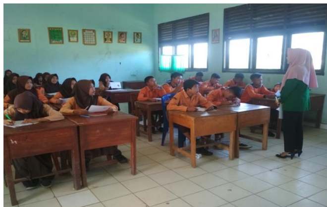
Gambar 3. Peneliti Dan Siswa Menyimpulkan Materi Yang Telah Dipelajari

peneliti memberikan kesempatan kepada siswa untuk bertanya tentang materi yang belum dimengerti. Aktivitas ini dapat dilihat pada gambar 3 berikut: