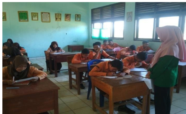
Gambar 2 Siswa Menyelesaikan Soal atau Jawaban pada Kartu