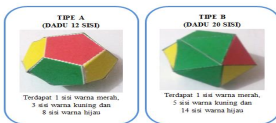
GAMBAR 2. Konteks Dadu pada Pertemuan Kedua