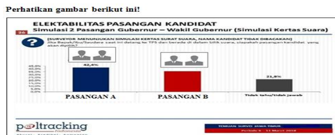
GAMBAR 3. Konteks Masalah pada LKS Pertemuan Ketiga

Melalui pertemuan ketiga ini, siswa sudah dapat mengembangkan pemahamannya tentang peluang empirik. Siswa dapat mengeksplorasi pengetahuannya yang telah di dapat pada pertemuan sebelumnya dan siswa dapat memilih atau menggunakan prosedur yang sesuai dalam menyelesaikan soal yang berkaitan dengan peluang.