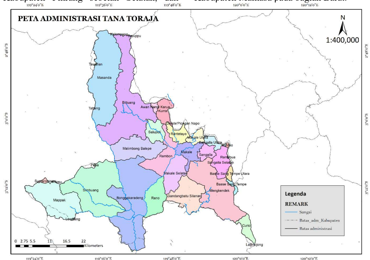
Gambar 1 Lokasi Penelitian Kerawanan Longsor

Provinsi Sulawesi Barat khususnya Kabupaten Mamasa pada bagian Barat.