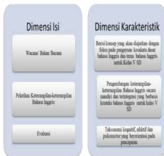
Gambar 1. Model Rancangan Bahan Ajar Bahasa Inggris untuk Kelas V Sekolah Dasar Berbasis Pendekatan Kontekstual

Bahan ajar bahasa Inggris yang sekarang dipakai juga memuat kosakata bahasa Inggris ( vocabularies ) yang jarang dijumpai para siswa sekolah dasar sehari-hari. Padahal seyogyanya untuk pembelajaran bahasa Inggris di sekolah dasar, bahan ajar memuat kosakata sehari-hari yang bersifat “ here ” and “ now ” yang selalu ditemui anak dalam kehidupannya disertai dengan ilustrasi dan penempatan kosakata tersebut dalam konteks yang tepat untuk mempermudah anak memahami kosakata tersebut. Kelemahan lain dari bahan ajar-bahan tersebut yang terekam dalam temuan pada studi pendahuluan adalah petunjuk pengerjaan soal/ latihan ( direction ) yang terdapat dalam bahan ajar yang seringkali malah membingungkan para siswa dalam mengerjakan suatu tes/ latihan. Sedangkan temuan dari hasil analisis kebutuhan menunjukkan bahwa baik guru bahasa Inggris di sekolah dasar maupun siswa kelas V sekolah dasar sama-sama menghendaki tersedianya bahan ajar bahasa Inggris untuk siswa sekolah dasar yang sesuai dengan perkembangan karakteristik dan bahasa siswa sekolah dasar yang disesuaikan dengan konteks yang dihadapi oleh siswa sekolah dasar sehari-hari sehingga bisa mereka aplikasikan secara nyata.