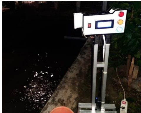
Gambar 2 Alat Aktual

Hasil pengujian sistem monitoring ketinggian air, debit air, curah hujan pada Sungai berbasis IoT. Pada Tabel 2 hasil pengujian rain gauge sensor dengan menggunakan alat ukur Multimeter didapatkan tegangan dengan nilai input regulator terukur 5.056 Vdc. Pada