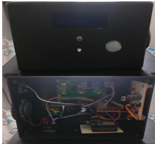
Gambar 2. Bentuk Fisik Pengukur Suhu Tubuh Manusia

Sistem pengukur suhu tubuh jarak jauh berhasil dirancang dengan menggunakan sensor MLX90614 sebagai pendeteksi suhu tubuh tanpa kontak, ESP-32 CAM sebagai mikrokontroler sekaligus modul komunikasi IoT, serta LCD 16x2 sebagai tampilan lokal. Indikator berupa LED dan buzzer dipasang untuk memberikan peringatan secara langsung, sedangkan hasil pengukuran juga dikirimkan melalui aplikasi Telegram pada smartphone pengguna. Secara fisik, seluruh komponen dirakit dalam satu box sehingga praktis digunakan pada pintu masuk rumah atau gedung. Sistem dapat bekerja secara otomatis ketika sensor PIR mendeteksi adanya manusia di depan alat.