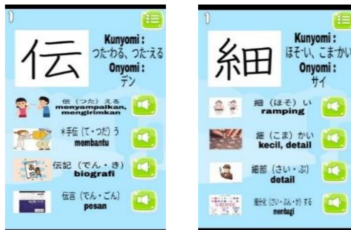
Gambar 3. Tampilan Materi Bab 37 dan Bab 38

Pertemuan ketiga dilaksanakan pada tanggal 18 Mei 2021. Pada tatap maya ketiga ini durasi pembelajaran berlangsung selama 100 menit. Pertama-tama peneliti memberikan link presensi untuk diisi mahasiswa. Kemudian mahasiswa mengerjakan kuiz kanji Bab 35 dan Bab 36 selama 10 menit pada link google form yang dibagikan melalui Edmodo . Selanjutnya pembelajaran tatap maya dilakukan menggunakan google meet untuk membahas materi Bab 37 mengenai “kata kerja transitif dan intransitif” dan Bab 38 mengenai “kata sifat” pada media Genji .