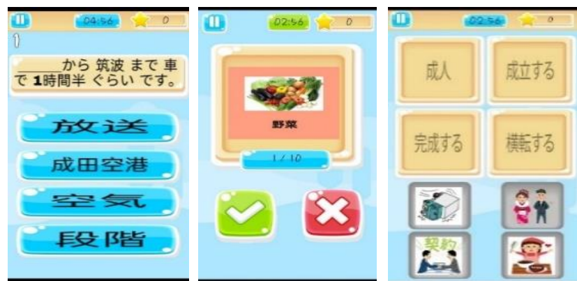
Gambar 4.4 Tampilan Multiple Choice , True or False dan Drag and Drop

Untuk pertemuan keempat ini peneliti menjelaskan materi kanji menggunakan PDF Basic Kanji Book II . Setelah membahas materi, peneliti mengarahkan mahasiswa membuka game Genji untuk melatih menulis kanji dan bermain game True or false dan Drag and Drop . Kemudian mahasiswa diberikan latihan individu dan tugas rumah, yaitu mengerjakan latihan menulis dengan menuliskan bentuk kanji beserta artinya, multiple choice , true or false , serta mengerjakan latihan listening . Kemudian tugas tersebut dikumpulkan dengan cara menangkap layar atau screenshot smartphone ataupun laptop. Setelah itu, tugas dikirim ke Edmodo .