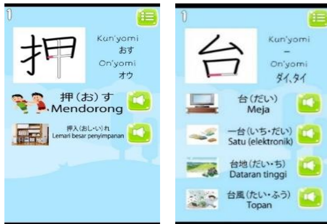
Gambar 1. Tampilan Materi Bab 33 dan Bab 34

Mahasiswa dilatih menulis kanji dan bermain game True or False , Drag and Drop , dan Listening . Kemudian mahasiswa diberikan latihan dari game tersebut. Mahasiswa diminta mengerjakan tugas yang terdapat pada game yaitu menulis bentuk kanji beserta artinya dan mengerjakan latihan berupa soal pilihan ganda dengan menangkap layar atau screenshot smartphone ataupun laptop. Kemudian tugas dikirim ke Edmodo .