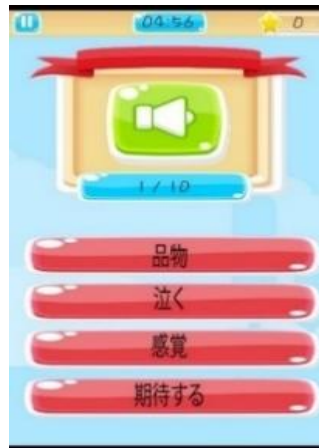
Gambar 2. Tampilan Listening Pada media Genji