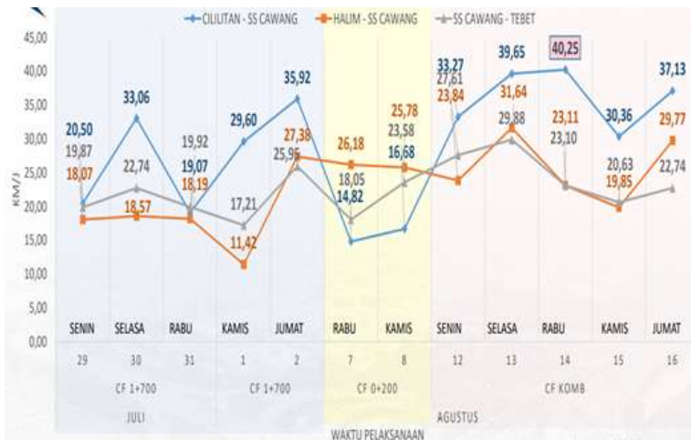
Gambar 3. Grafik perbandingan kecepatan