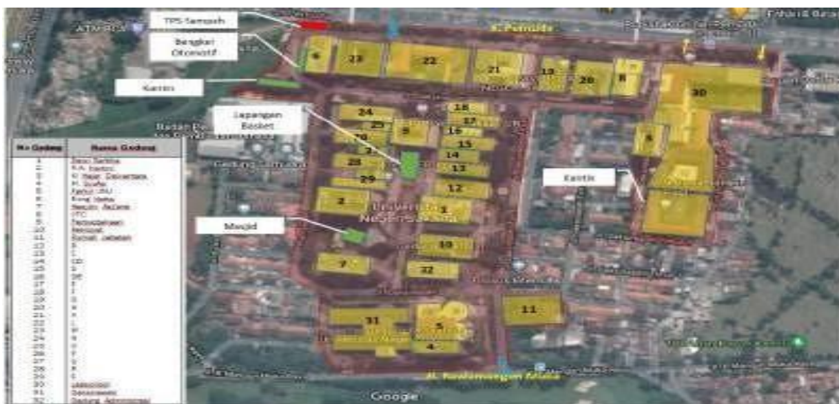
Gambar 1. Sebaran Gedung di Kawasan Kampus A UNJ