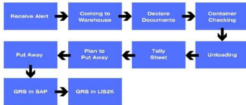
Gambar 4. Inbound Process Workflow