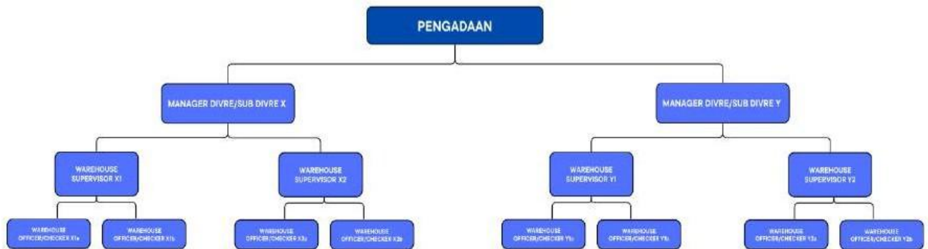
Gambar 2. Struktur Organisasi Pergudangan