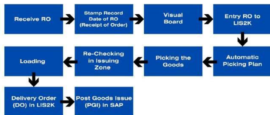
Gambar 5. Outbound Process Workflow

Proses serupa dengan GRS di SAP, tetapi dilakukan dalam sistem LIS2K. Hal ini bertujuan untuk memastikan data penerimaan barang terekam di berbagai sistem, meningkatkan keakuratan pencatatan stok.