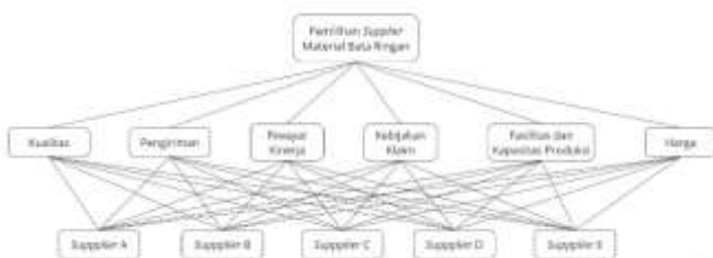
Gambar 2. Model Hubungan Kriteria dengan Alternatif

Sehubungan dengan hal tersebut bertujuan untuk menjawab pertanyaan dalam kuesioner sehingga menghasilkan bobot yang valid karena telah dibandingkan antar variabelnya. Hubungan antar kriteria dengan alternatif pilihan supplier dengan menggunakan metode AHP dimodelkan pada Gambar 2.