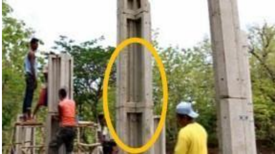
Gambar 4. Panel Struktural P2 sebagai Kolom

Namun Panel P2 lebih sering digunakan sebagai komponen kolom pendukung (yang digabungkan dengan Panel P1) seperti ditunjukkan pada Gambar 4.