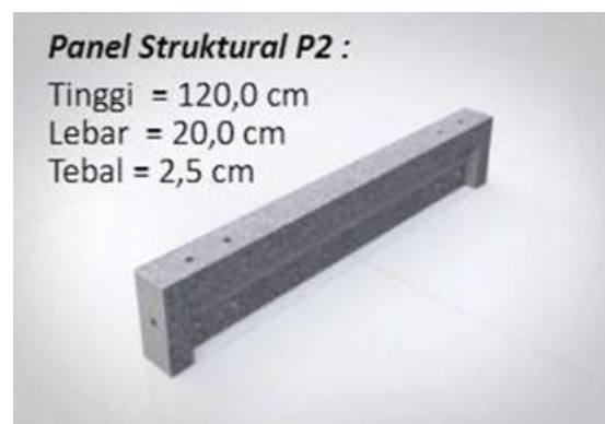
Gambar 3. Panel Struktural P2

Panel Struktural P2 seperti ditunjukkan pada Gambar 3 melakukan peran yang sama dengan Panel Struktural P1 sebagai pemikul beban baik untuk beban hidup maupun mati saat permukaan tertutup dan buram.