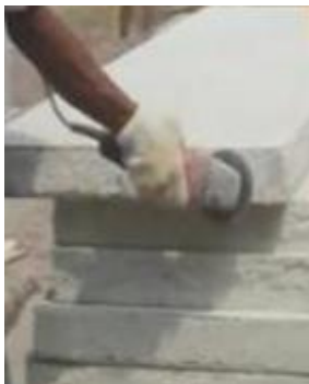
Gambar 8. Dinding Pracetak

Bahan penutup panel yang tahan air antara lain batu bata, hebel, anyaman triplek yang terbuat dari bambu atau bahan sejenis, papan kalsium silika ( calsi ), GRC, atau bahan berkualitas tinggi lainnya. Gambar 8 menunjukkan penggunaan bahan pracetak sebagai dinding RISHA.