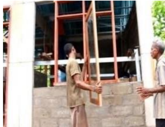
Gambar 9. Jendela dari Kayu

Bahan jendela dan pintu untuk konstruksi RISHA dapat berupa kayu seperti ditunjukkan pada Gambar 9 atau sekurang-kurangnya dari papan kayu kelas III atau bahan lain yang dapat digunakan, seperti aluminium atau baja ringan, dapat digunakan untuk membuat bahan lembaran panel.