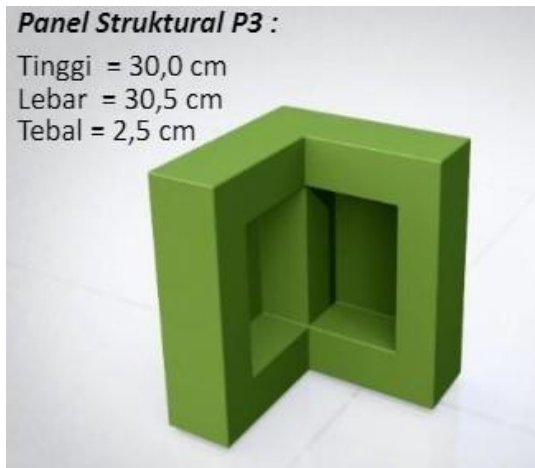
Gambar 5. Panel Struktural P3

Panel 3 memiliki ketebalan 2,5 cm dengan lebar 30 cm, dan tinggi 30 cm seperti ditunjukkan pada Gambar 5, memiliki permukaan tertutup dan tidak tembus cahaya berfungsi sebagai simpul atau penyambung untuk membawa beban kerja, baik beban mati maupun beban hidup.