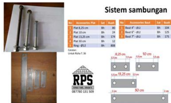
Gambar 7. Komponen Pengikat Antar Panel

Untuk mencegah kerusakan beton, pengikat antar panel diperkuat dengan ring dan pelat galvanis serta menggunakan baut 12 mm dengan panjang 4", 6", dan 7" ditunjukkan pada Gambar 7.