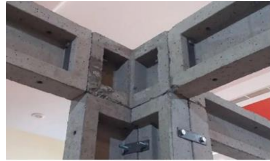
Gambar 6. Panel P3 Penghubung Sloof yang Tersusun dari Panel P1

Gambar 6 menunjukkan fungsi Panel P3 yang berfungsi sebagai titik simpul di mana kaki rangka, kolom, dan balok atap bersatu selama konstruksi.