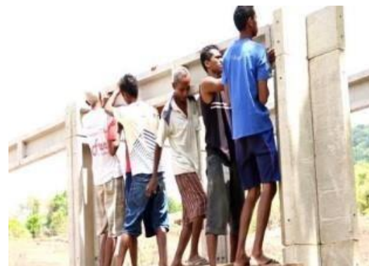
Gambar 2. Panel Struktural P1 sebagai Balok

Ilustrasi pemasangan panel struktural P1 dan penggunaannya sebagai balok ditunjukkan pada Gambar 2.