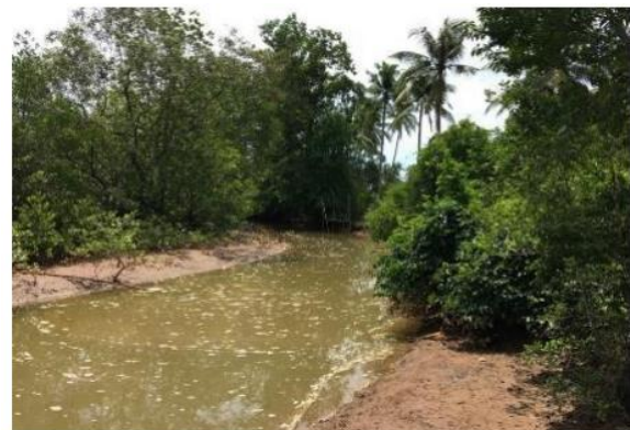
Gambar 2. Kondisi Sungai Pahari

Waktu yang ditempuh dari Banjarmasin menuju lokasi studi adalah \pm 6 jam dengan jarak \pm 300 km dan dapat ditempuh menggunakan transportasi udara dan transportasi darat yaitu kendaraan roda dua ataupun roda empat. Gambar 2 adalah kondisi Sungai Pahari pada muka air normal.