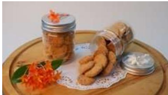
Gambar 4. Produk Crimps ( Cracker From Milk Fish )