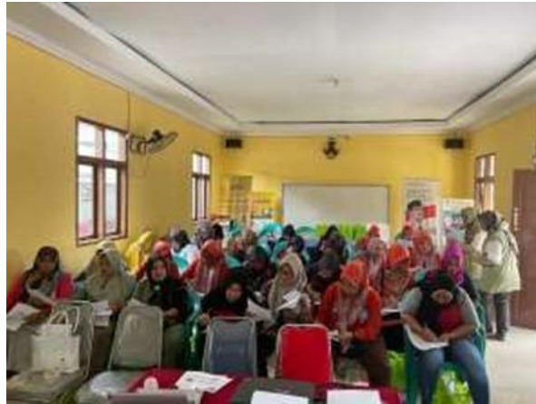
Gambar 7. Pengisian Post Test oleh Peserta Pengabdian Masyarakat