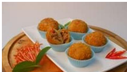
Gambar 5. Produk De'nah ( Onde-Onde Ngeunah )