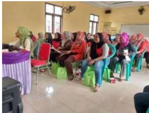
Gambar 3. Peserta Pengabdian Masyarakat