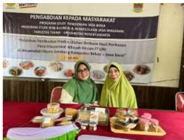
Gambar 2. Foto Narasumber

Untuk aspek kebermanfaatan/kepuasan masyarakat terhadap kegiatan yang diberikan didapatkan sebanyak 5 orang peserta (16%) menyatakan bermanfaat dan 26 orang peserta (84%) menyatakan sangat bermanfaat.