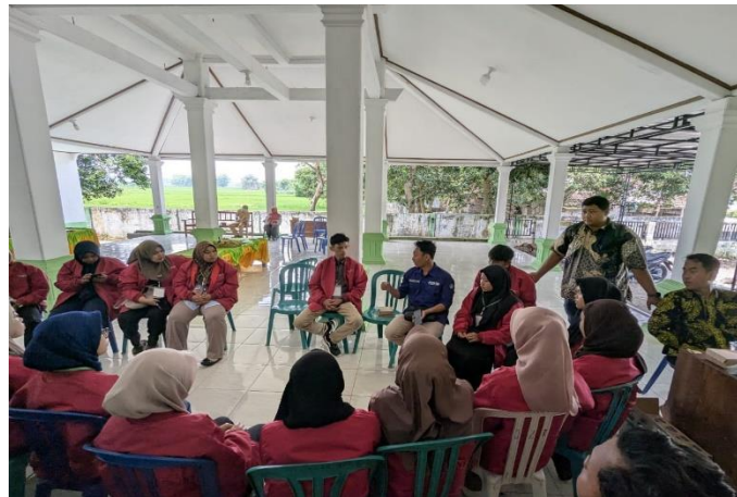
Gambar 2. Pelaksanaan FGD dan Branstroming

Kegiatan pelatihan ini melibatkan perangkat desa, poktan, karang taruna serta ibu PKK, dan bersifat partisipatif. Kegiatan ini diawali dengan pembukaan, meliputi: pembukaan, sambutan ketua pelaksana kegiatan, kepala Desa Pengampon, diakhir penutup dan do'a. kemudian masuk pada sesi kegiatan inti yakni pemaparan materi dan pelatihan.