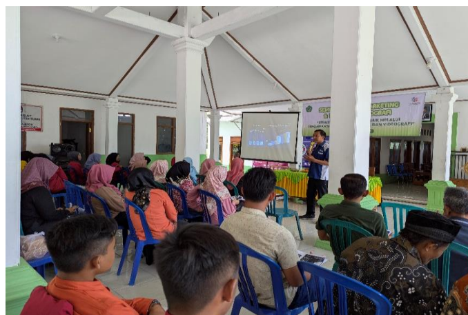
Gambar 3. Pelaksanaan Pelatihan Pemanfaat Platform digital warga Desa Pengampon

Dalam pemaparan ketua pelaksana kegiatan, menyampaikan tujuan kegiatan pelatihan dilakukan, hal tersebut diurai berdasarkan hasil observasi awal dan FGD oleh perwakilan masyarakat. Selanjutnya pemaparan tersebut direspon baik oleh kepala desa melalui sambutannya. Beliau berharap kegiatan pelatihan pemanfaatan platform digital yang dilakukan oleh civitas Universitas Darul Ulum (UNDAR) dapat terus berjalan, dan berkelanjutan.