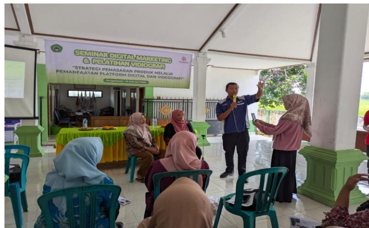
Gambar 4. Screening dan Evaluasi Pre-test dan Post-test

Pada tahapan evaluasi, pemateri melakukan screening melalui pre-test , diharapkan mendapatkan gambaran umum pemahaman dasar yang dimiliki oleh peserta. Begitu juga setelah kegiatan pelatihan yang diadakan, pemateri melakukan evaluasi efektifitas pelaksanaan pelatihan dan pemahaman materi melalui post-test untuk melihat sejauh mana peserta memahami dan menguasai materi. (Magdalena dkk., 2021).