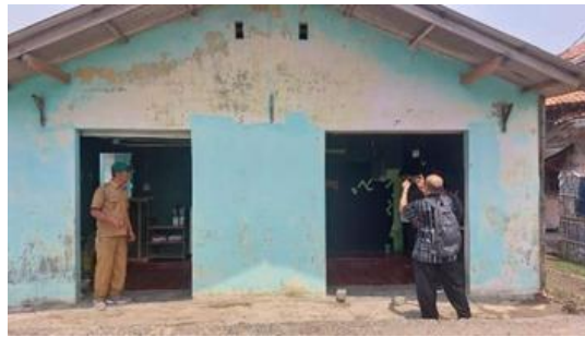
Gambar 2. Bangunan Kosong Lokasi Penyediaan Air Bersih

Dalam tubuh manusia, paru-paru merupakan organ tubuh yang paling banyak mengandung air dibandingkan organ tubuh yang lain seperti ginjal, otak, dan kulit. Maka dari itu, manusia akan selalu membutuhkan air dalam kehidupan sehari-hari. Fungsi air dalam kehidupan manusia sangat beragam, salah satunya untuk menghidrasi tubuh dengan meminum air yang layak diminum. Kondisi perairan desa Pantai Sederhana, kecamatan Muara Gembong, Kabutapen Bekasi, Jawa Barat bersifat payau dan tidak layak diminum. Sumber air yang dapat digunakan dan diolah menjadi air layak minum adalah air tanah. Maka dari itu, Fakultas Teknik Universitas Negeri Jakarta menyediakan air layak minum di desa Pantai Sederhana, kecamatan Muara Gembong dengan memanfaatkan air tanah melalui pembuatan sumur bor. Dengan melakukan kegiatan pengabdian masyarakat terhadap desa Pantai Sederhana, kecamatan Muara Gembong, Kabupaten Bekasi, Jawa Barat, bertujuan sebagai solusi efektif dan efisien dalam menyediakan air bersih layak minum. Selain itu, dengan kegiatan pengabdian dapat menjadi bukti pentingnya melibatkan kerjasama antara perguruan tinggi, pemerintah, dan masyarakat dalam mengatasi masalah lingkungan sosial.