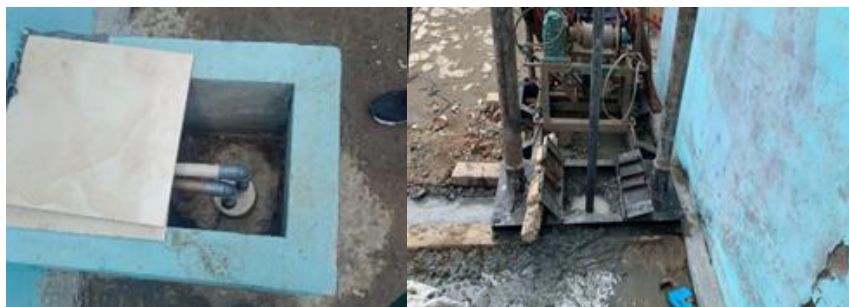
Gambar 4. Desain Sumur Bor

Hasil desain sumur bor berada di sisi samping bangunan operasional penyediaan air bersih di desa Pantai Sederhana. Air sumur bor diperoleh dari sumber air tanah yang berada pada lapisan akuifer. Lapisan akuifer merupakan lapisan berisi bebatuan atau material pori yang berguna untuk menyimpan dan mengalirkan air. Setelah proses pengeboran menuju lapisan akuifer tadi, sumur dilengkapi dengan pipa yang berfungsi untuk memompa air menuju permukaan.