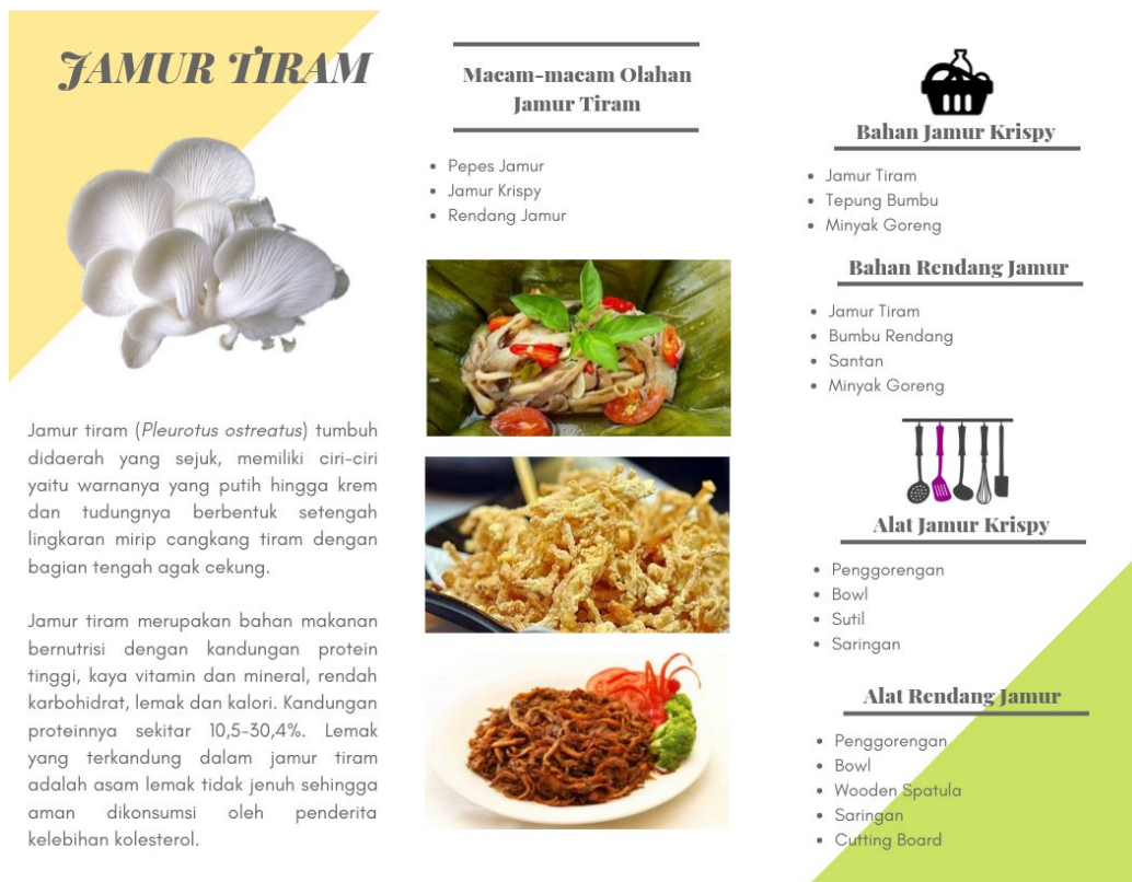
Gambar 4. Brosur Produk Olahan Jamur Tiram

Brosur produk olahan jamur tiram ditunjukkan pada Gambar 4 sebagai berikut.