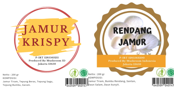
Gambar 3. Label Produk Olahan Jamur Tiram

Brosur produk olahan jamur tiram ditunjukkan pada Gambar 4 sebagai berikut.