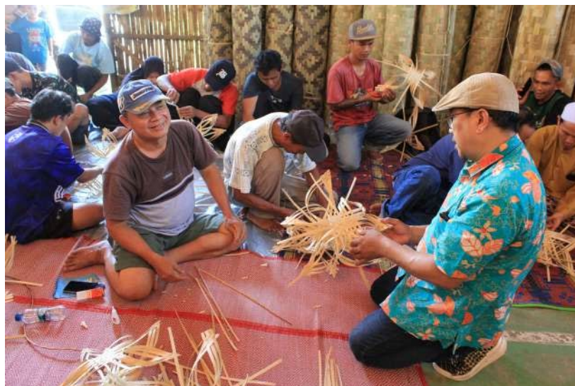
Gambar 5. Pelatihan Keterampilan Menganyam Bambu

Setelah selesai untuk pelatihan di sesi pertama, dilanjut dengan Pelatihan Keterampilan Menganyam Bambu yang bertujuan untuk mengembangkan produk baru yang belum ada dan sesuai dengan kebutuhan pasar, seperti topi, tas, sepatu, peci, dan karya unik lainnya. Kegiatan ini dimulai dengan ceramah yang dilakukan selama 25 menit, kemudian telah disiapkan beberapa iratan bambu yang kemudian dibagikan kepada peserta yang hadir. Peserta diminta untuk membuat anyaman dengan diberi hitungan. Dari yang tercepat sampai paling akhir akan dikelompokkan menjadi dua Kelompok tercepat atau paling terampil dalam menganyam akan membuat kerajinan kapal selam, serta kelompok yang paling terakhir akan membuat hiasan untuk lampu dan hiasan dinding. Sesi ini berdurasi 1 jam 50 menit dan berhasil menghasilkan 35 buah kerajinan, seperti yang terlihat pada Gambar 5.