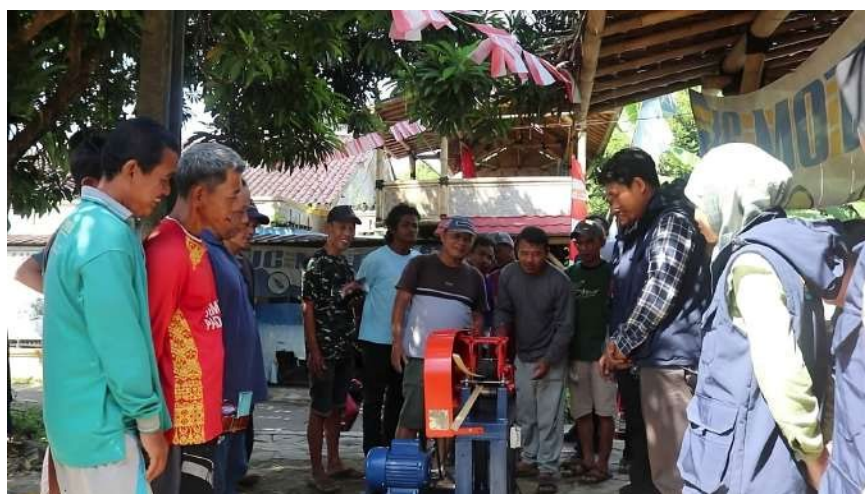
Gambar 4. Pelatihan Pengoperasian Mesin Pemotong Irat Bambu

Selanjutnya, acara dilanjutkan dengan mengedarkan buku panduan pengoperasian mesin irat bambu beserta prosedur perawatan mesin. Kemudian, dilakukan demonstrasi mesin irat bambu selama 45 menit. Alat ini terdiri dari motor penggerak, transmisi rantai dan puli, roll, pisau pembelah, dan pengirat bambu. Mesin pemotong bambu PASAK ini telah dirancang khusus untuk menghasilkan irisan bambu dengan dimensi yang seragam dan dapat diatur ketebalannya. Dilanjutkan dengan beberapa peserta untuk mempraktikkan mesin secara langsung. Sebelumnya telah disiapkan lonjor bambu utuh yang kemudian dipotong dan dibelah hingga ketipisan mencapai 1.5 mm - 3 mm. Sehingga, kinerja mesin cukup cepat dibanding proses pengiratan manual tanpa dibantu mesin seperti yang terlihat pada Gambar 4.