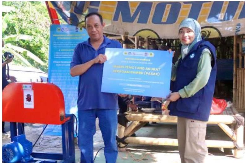
Gambar 3. Simbolis Serah Terima Alat

Selanjutnya, acara dilanjutkan dengan mengedarkan buku panduan pengoperasian mesin irat bambu beserta prosedur perawatan mesin. Kemudian, dilakukan demonstrasi mesin irat bambu selama 45 menit. Alat ini terdiri dari motor penggerak, transmisi rantai dan puli, roll, pisau pembelah, dan pengirat bambu. Mesin pemotong bambu PASAK ini telah dirancang khusus untuk menghasilkan irisan bambu dengan dimensi yang seragam dan dapat diatur ketebalannya. Dilanjutkan dengan beberapa peserta untuk mempraktikkan mesin secara langsung. Sebelumnya telah disiapkan lonjor bambu utuh yang kemudian dipotong dan dibelah hingga ketipisan mencapai 1.5 mm - 3 mm. Sehingga, kinerja mesin cukup cepat dibanding proses pengiratan manual tanpa dibantu mesin seperti yang terlihat pada Gambar 4.