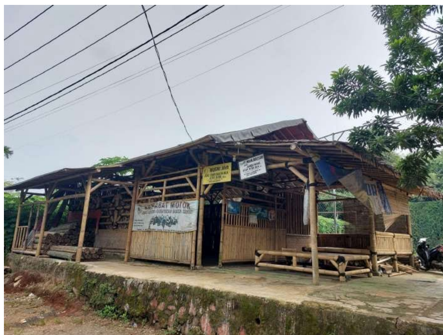
Gambar 1. Workshop Mugni Sumber Jaya

berdasarkan hasil observasi awal yang telah dilakukan, kelompok ini menghadapi berbagai tantangan dalam aspek produksi juga keterampilan yang masih perlu ditambah. Kendala dalam proses produksi, mereka masih mengandalkan alat-alat tradisional seperti golok atau pisau untuk membelah dan memotong bambu Hasil kajian (Sugiono dkk., 2023), penggunaan alat tradisional untuk proses produksi ini akan menghasilkan iratan bambu dengan dimensi tidak seragam dan waktu produksi yang kurang efisien. Selain itu, keterampilan penganyaman yang masih terbatas membuat kelompok ini belum mampu memproduksi produk anyaman secara mandiri, sehingga harus bergantung pada pihak luar untuk produk seperti bilik. Workshop Mugni Sumber Jaya ditunjukkan pada Gambar 1.