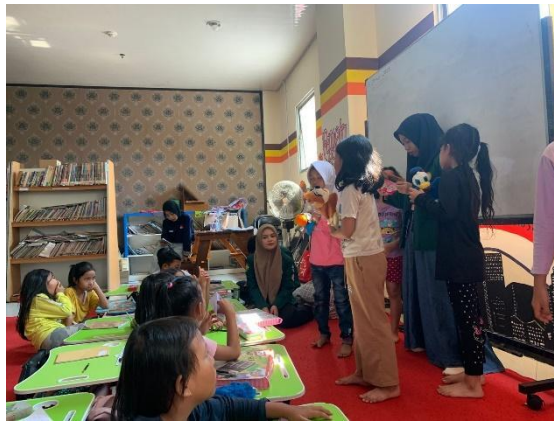
Gambar 5. Peserta mencoba untuk berdongeng

Setelah pelaksana melakukan penyampaian materi melalui dongeng, pelaksana memberikan kesempatan kepada peserta untuk mendemonstrasikan dongeng dengan media pendukung boneka tangan di depan peserta lainnya. Dengan kesempatan yang diberikan oleh pelaksana ini menimbulkan reaksi antusias dan rasa ingin tahu dari para peserta untuk mencoba mendongeng, seperti yang dikatakan oleh Gusmayanti & Dimiyati (2021) mendongeng merupakan sebuah interaksi antara pendongeng dengan pendengarnya yang akan membuat hubungan timbal balik di antara pendongeng dan pendengar. Selain itu, para peserta yang tidak berkesempatan untuk mendemonstrasikan juga menunjukkan perilaku yang sabar untuk mendemonstrasikan secara bergantian nantinya.