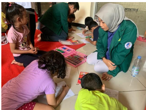
Gambar 6. Kegiatan mewarnai

Setelah pelaksana melakukan penyampaian materi melalui dongeng, pelaksana memberikan kesempatan kepada peserta untuk mendemonstrasikan dongeng dengan media pendukung boneka tangan di depan peserta lainnya. Dengan kesempatan yang diberikan oleh pelaksana ini menimbulkan reaksi antusias dan rasa ingin tahu dari para peserta untuk mencoba mendongeng, seperti yang dikatakan oleh Gusmayanti & Dimiyati (2021) mendongeng merupakan sebuah interaksi antara pendongeng dengan pendengarnya yang akan membuat hubungan timbal balik di antara pendongeng dan pendengar. Selain itu, para peserta yang tidak berkesempatan untuk mendemonstrasikan juga menunjukkan perilaku yang sabar untuk mendemonstrasikan secara bergantian nantinya.