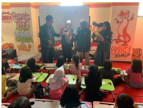
Gambar 4. Penyuluh memulai kegiatan pemberian materi dengan mendongeng

pembelajaran, di tengah, maupun di akhir proses pembelajaran supaya peserta didik mampu fokus kembali dan mampu menerima pelajaran dengan baik. Ice breaking dalam pembelajaran dapat diartikan sebagai pemecahan situasi kebekuan pikiran sehingga membuat perasaan menjadi senang (Rexsa Habsah et al., 2020). Ice breaking dilakukan dengan permainan melatih kefokusannya yaitu tepuk 123 kosong. Setelah ice breaking dilakukan, kegiatan beralih kepada pengisian pre-test oleh para peserta yang berisi 10 soal mengenai materi yang akan disampaikan pada kegiatan inti penyuluhan. Pre-test digunakan sebagai peninjauan guna mengetahui kemampuan awal peserta (Aliyah et al., 2021).