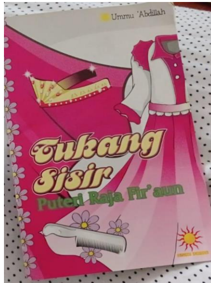
Gambar 2. Buku Cerita Tukang Sisir Putri Raja Fir'aun

Pelaksanaan penyuluhan diadakan dalam waktu satu yakni waktu siang hari. Sebelum memasuki kegiatan penyuluhan, kegiatan dibuka dengan ketua umum COMDEV FT UNJ yang menghimbau kepada peserta bahwa kegiatan penyuluhan akan dimulai, lalu ketua umum Comdev FT UNJ mempersilakan pelaksana untuk mengambil alih kegiatan. Kegiatan penyuluhan dibuka dengan MC yang memperkenalkan diri serta mengajak para peserta untuk berdoa sebelum memulai kegiatan. Lalu kegiatan dilanjutkan dengan melakukan presensi oleh pelaksana untuk memastikan peserta yang datang telah hadir sepenuhnya. Setelah memastikan peserta telah hadir semua, MC memperkenalkan para pelaksana kepada peserta beserta tujuan dan kegiatan dari diadakannya penyuluhan kepada peserta.