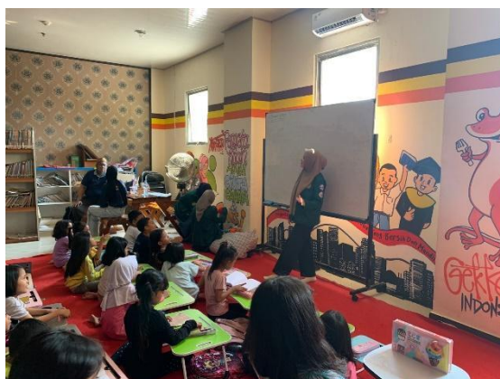
Gambar 3. MC memulai membuka acara

Pelaksanaan penyuluhan diadakan dalam waktu satu yakni waktu siang hari. Sebelum memasuki kegiatan penyuluhan, kegiatan dibuka dengan ketua umum COMDEV FT UNJ yang menghimbau kepada peserta bahwa kegiatan penyuluhan akan dimulai, lalu ketua umum Comdev FT UNJ mempersilakan pelaksana untuk mengambil alih kegiatan. Kegiatan penyuluhan dibuka dengan MC yang memperkenalkan diri serta mengajak para peserta untuk berdoa sebelum memulai kegiatan. Lalu kegiatan dilanjutkan dengan melakukan presensi oleh pelaksana untuk memastikan peserta yang datang telah hadir sepenuhnya. Setelah memastikan peserta telah hadir semua, MC memperkenalkan para pelaksana kepada peserta beserta tujuan dan kegiatan dari diadakannya penyuluhan kepada peserta.