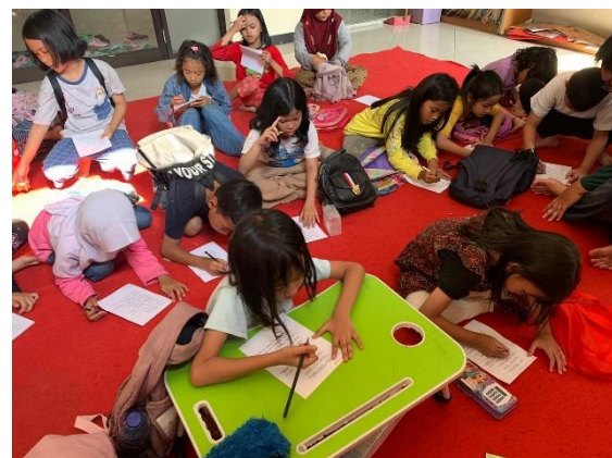
Gambar 7. Pelaksanaan post-test

Setelah kegiatan mendongeng selesai, peserta diberikan kegiatan pendukung untuk memberikan kesan ceria dengan mewarnai. Peralatan yang digunakan untuk mewarnai berupa pensil warna dan krayon, ada beberapa peserta yang sudah membawa perlengkapan mewarnai sendiri dari rumah, dan ada pula peserta yang tidak membawa peralatan mewarnai. Peserta yang tidak membawa perlengkapan mewarnai, pelaksana sudah menyiapkan