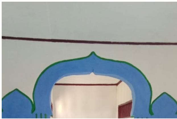
Gambar 4. Hasil Revitalisasi Plafon

Revitalisasi plafon musholla ini tidak hanya menyelesaikan permasalahan fisik bangunan, tetapi juga memiliki dampak yang lebih luas. Dari aspek sosial, kegiatan ini meningkatkan kenyamanan dan keamanan beribadah bagi siswa dan guru, sekaligus menjadi sarana edukasi dalam pemeliharaan fasilitas umum. Pendekatan partisipatif yang melibatkan mahasiswa sesuai dengan prinsip Merdeka Belajar Kampus Merdeka (MBKM), memberikan pengalaman langsung dalam penerapan ilmu teknik sipil di lapangan. Hasil revitalisasi plafon ditunjukkan pada Gambar 4 berikut.