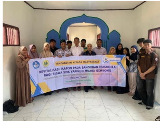
Gambar 5. Peresmian Revitalisasi Plafon

Hasil dari kegiatan ini menunjukkan peningkatan signifikan terhadap kualitas fisik bangunan musholla, baik dari aspek kenyamanan maupun fungsi. Plafon yang sebelumnya rusak kini telah diperbaiki menjadi permukaan yang lebih rata, bersih, dan tahan terhadap kelembapan. Selain memperbaiki kondisi ruang ibadah, kegiatan ini juga memberikan kontribusi dalam penguatan kapasitas masyarakat sekolah melalui keterlibatan langsung dalam proses pelaksanaan, serta menjadi media pembelajaran bagi mahasiswa dalam penerapan ilmu teknik sipil secara praktis di lapangan. Dokumentasi peresmian ditunjukkan pada Gambar 5.