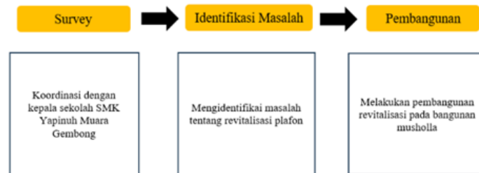
Gambar 3. Metode Pelaksanaan

Berdasarkan solusi permasalahan yang telah dijelaskan, maka metode yang digunakan adalah Deskriptif Kuantitatif dengan teknik pengambilan data melalui survey, observasi dan wawancara. Secara umum metode pelaksanaan terdapat pada Gambar 3.