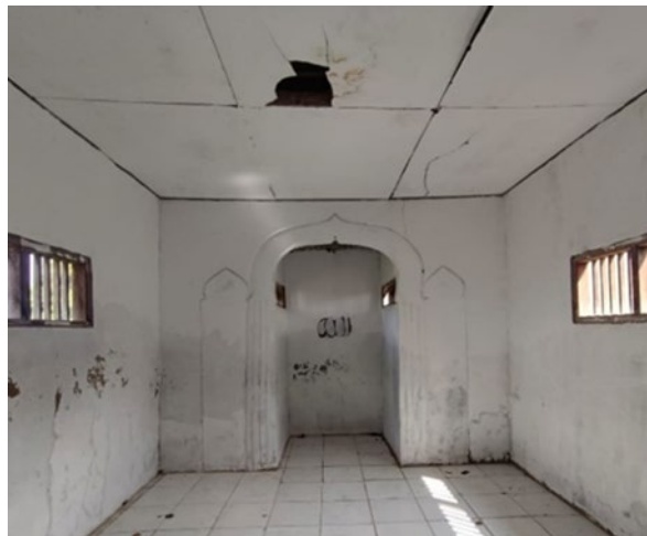
Gambar 1. Kondisi Awal Bangunan

Berdasarkan hasil survei lapangan, jika ditinjau kembali secara seksama pada bagian konstruksi musholla terdapat kerusakan struktur pada bagian plafon dan dinding musholla dapat dilihat pada Gambar 1. Beberapa kerusakan tersebut dapat terlihat langsung bagi siapa saja mengunjungi atau hendak memakai fasilitas musholla. Kerusakan yang ada dapat mengganggu keselamatan dan kenyamanan siswa, sehingga dapat dikatakan fasilitas tersebut belum cukup memadai dari segi keamanan (Kurniasih dkk., 2021).