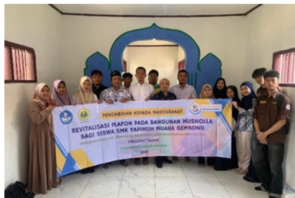
Gambar 5. Peresmian Revitalisasi Lantai

Kegiatan ini juga menghasilkan luaran berupa dokumentasi video, publikasi media, serta artikel jurnal sebagai bentuk diseminasi hasil pengabdian, yang sekaligus mendukung capaian Indikator Kinerja Utama (IKU) perguruan tinggi. Dengan demikian, kegiatan ini tidak hanya memberikan manfaat teknis bagi mitra, tetapi juga berdampak pada penguatan tridharma perguruan tinggi. Dokumentasi peresmian ditunjukkan pada Gambar 5.