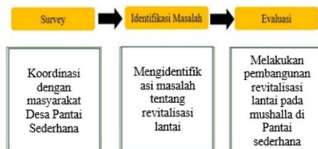
Gambar 3. Metode Pelaksanaan