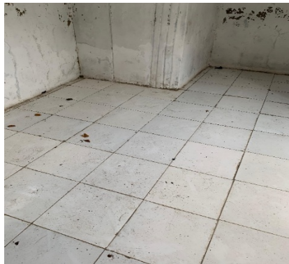
Gambar 1. Kondisi Bangunan Lantai Musholla

Pertumbuhan jamur dan lumut adalah masalah umum, terutama di daerah lembap seperti pesisir pantai, kamar mandi, dapur, atau area teduh luar ruangan. Lumut dan jamur tumbuh karena kelembapan tinggi, sirkulasi udara buruk, dan permukaan lantai yang sering basah atau jarang dibersihkan, kerusakan ini tidak hanya mengganggu kenyamanan beribadah tetapi juga membahayakan keselamatan pengguna (Susetya dan Dewi, 2021). Di sisi lain, musholla memiliki nilai penting sebagai pusat kegiatan spiritual dan sosial di sekolah, sehingga revitalisasi fasilitas ini menjadi sangat mendesak, kondisi lantai bangunan dapat dilihat pada Gambar 1.