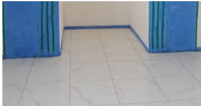
Gambar 4. Hasil Revitalisasi Lantai

serta menghasilkan sejumlah luaran wajib seperti video dokumentasi di YouTube, artikel di media massa, dan naskah publikasi jurnal.