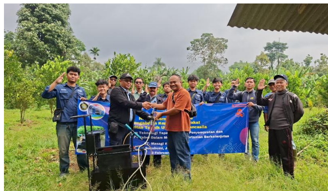
Gambar 10. Serah Terima Alat Penyemprot dan Pengasap Pestisida

Setelah alat dipastikan berfungsi sesuai dengan spesifikasi teknis yang ditetapkan, dilakukan proses serah terima kepada PT XYZ dan kelompok petani jeruk seperti yang tertera pada Gambar 10. Kegiatan ini dilaksanakan sebagai bentuk implementasi hasil pengujian dan validasi alat di lapangan. Penyerahan dilakukan secara langsung dengan disertai penjelasan terkait prosedur pengoperasian dan perawatan alat. Dengan demikian, diharapkan alat dapat dimanfaatkan secara optimal sesuai dengan tujuan penerapannya dalam kegiatan pertanian.