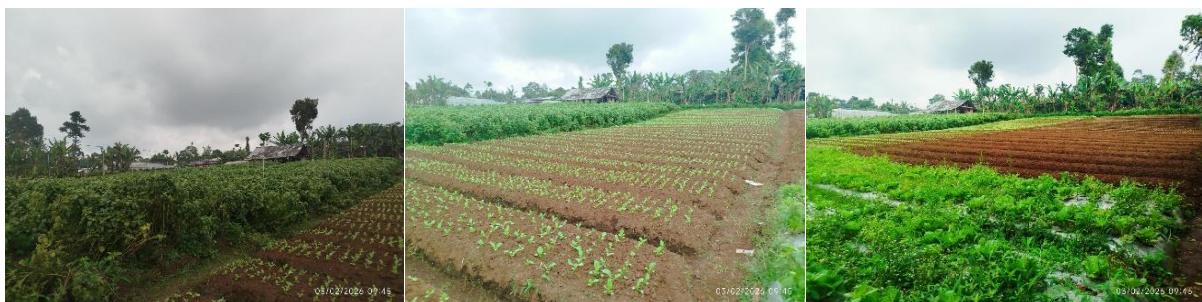
Gambar 2. Lahan Pertanian untuk Tanaman Sayur

Berdasarkan hasil survei, luas lahan pertanian di bawah naungan PT XYZ sekitar 1 Hektar. Lahan tersebut dibagi menjadi beberapa bagian untuk ditanami sayuran dan buah-buahan. Beberapa jenis tanaman yang dibudidayakan di lahan tersebut adalah ubi, daun perilla, jeruk, dll. kurang lebih \frac{1}{4} bagian ( 2500 \text{ m}^2 ) lahan tersebut, digunakan untuk menanam jeruk. Pohon jeruk ditanam cukup rapi pada lahan seluas 2500 \text{ m}^2 dengan jarak antarpohon 1– 2 m. Tanah pertanian yang cukup luas memerlukan waktu penyemprotan hama yang cukup lama dan tidak merata. Kondisi tersebut kurang efisien karena jangkauan alat penyemprot pestisida konvensional tidak terlalu luas mengingat kapasitas tangka relatif kecil. Kondisi lahan pertanian untuk tanaman sayur dapat dilihat pada Gambar 2 berikut.