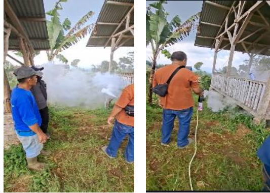
Gambar 9. Uji Coba Alat oleh Perwakilan PTXYZ Bersama Petani

Edukasi telah dilakukan untuk memastikan bahwa petani dapat mengoperasikan alat. Setelah dilakukan edukasi, petani mencoba mengoperasikan alat secara mandiri seperti yang ditunjukkan oleh Gambar 9.