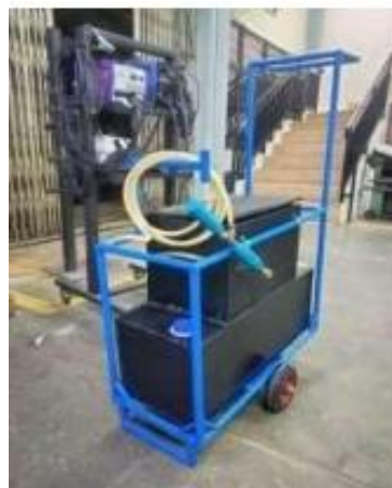
Gambar 6. Alat Penyemprot dan Pengasap Pestisida Portable

Selain komponen mekanik, komponen elektrik juga dirakit secara manual pada tahap ini. Sistem penggerak dalam hal ini pompa dinamo air, dihubungkan dengan inverter , aki mobil dan adaptor ke dalam sirkuit kontrol yang terlindungi. Komponen elektrikal ini didesain sedemikian rupa agar kedap air untuk menghindari risiko hubungan arus pendek pada saat penyemprotan berlangsung dan/atau cuaca tiba-tiba berubah menjadi hujan. Adapun gambar alat setelah selesai di- assembly dapat dilihat pada Gambar 6 berikut.