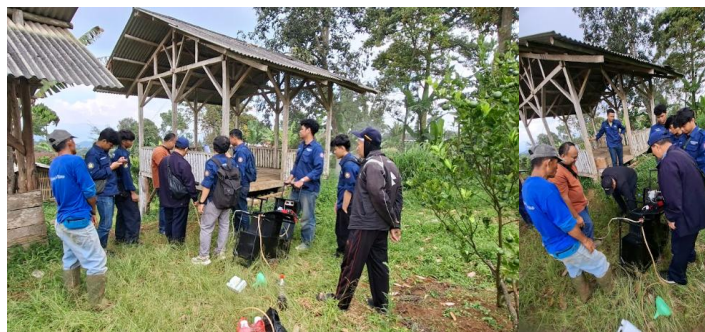
Gambar 8. Edukasi Penggunaan Alat Penyemprot dan Pengasap Pestisida

Hasil pengujian menyatakan bahwa alat telah siap digunakan sehingga dapat diserahkan ke PT XYZ. Sebelum proses serah-terima alat, dilakukannya perkenalan alat kepada perwakilan PT XYZ dan perwakilan petani. Edukasi penggunaan alat dilakukan agar petani dapat tetap mengoperasikan alat secara mandiri. Seperti yang terlihat pada Gambar 8, tahapan edukasi dimulai dari pengisian pestisida, menyalakan mesin penggerak, hingga mengatur kecepatan penyemprotan pada nozzle serta alat pengasap.