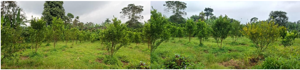
Gambar 3. Lahan Pertanian untuk Tanaman Jeruk

Kondisi lahan pertanian untuk tanaman sayur dapat dilihat pada Gambar 3 berikut.