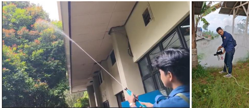
Gambar 7. Pengujian Alat Penyemprot dan Pengasapan Pestisida

Setelah proses pembuatan dan perakitan alat selesai, kemudian dilakukan uji fungsional terhadap alat tersebut. Tujuan dari pengujian ini yaitu untuk memastikan bahwa seluruh komponen alat saat dioperasikan dapat berfungsi sesuai dengan rancangannya. Dalam pengujian, dilakukan evaluasi kinerja terhadap sistem penyemprotan dan sistem pengasapan serta mobilitas alat ketika digunakan di lapangan. Hasil pengujian alat sprayer dan fogging pestisida ditunjukkan pada Gambar 7 berikut.