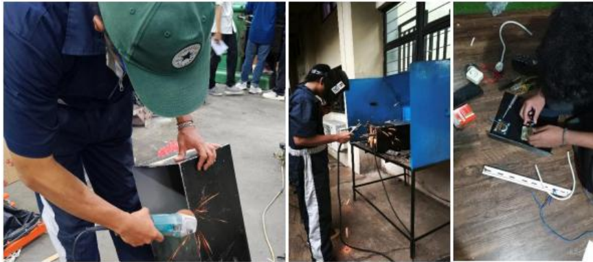
Gambar 5. Proses Manufaktur dan Perakitan Alat

Proses manufaktur dan perakitan alat dilakukan setelah desain selesai dibuat. Setiap komponen dibuat kemudian dipasang satu sama lain sehingga alat penyemprot dan pengasap pestisida. Seluruh proses ini dilaksanakan di Laboratorium Teknik Mesin Universitas Pancasila. Pertama dilakukan pembuatan rangka, kemudian dilanjutkan dengan pembuatan komponen lainnya seperti yang terlihat pada Gambar 5.