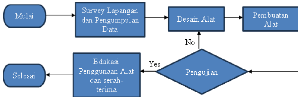
Gambar 1. Skema Pelaksanaan PkM di Kampung Pasir Halang

kelompok tani di Desa Pasir Halang. Gambaran umum pelaksanaan kegiatan PKM dapat dilihat pada Gambar 1 diagram berikut.