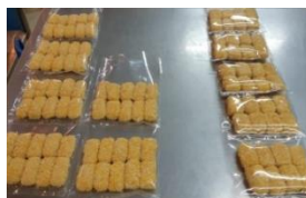
Gamba 1. Hasil Produk

Berdasarkan hasil percobaan pembuatan nugget dengan berat basis 700 gram dan berat produk 1500 gram maka mempunyai % produk adalah 53 %. Hasil dari pengamatan secara organoleptik pada nugget memiliki warna kuning keemasan khas nugget, beraroma singkong, tekstur renyah dan empuk dan kenampakannya menarik.