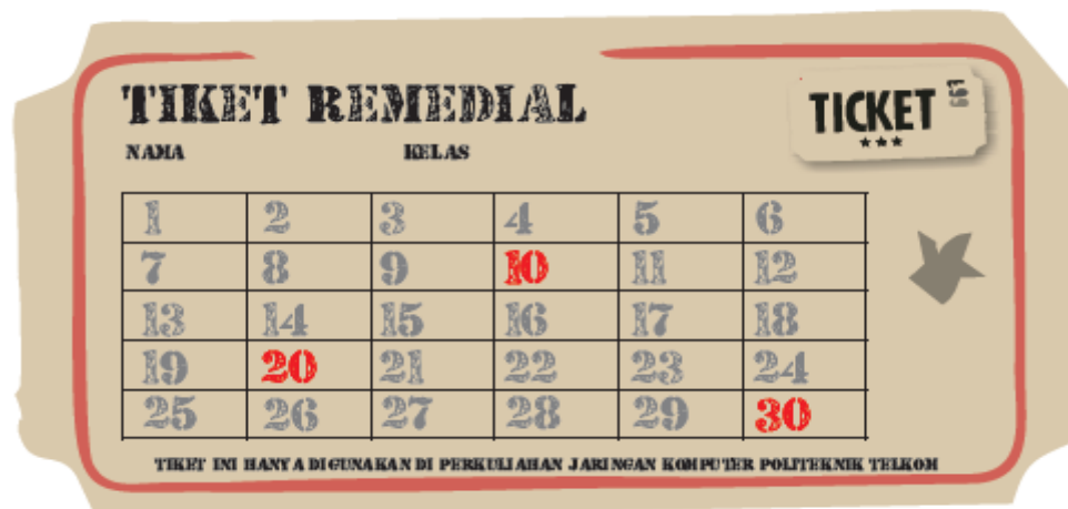
Gambar 2. Template TIKET REMEDIAL

diimplementasikan adalah maksimal nilai token per pertemuan adalah dua token per seorang yang bertanya. Aturan ini dimaksudkan agar kompetisi tetap adil dengan memberikan setiap mahasiswa hak untuk bertanya tanpa didominasi oleh mahasiswa tertentu (dengan cara terus bertanya dan tidak memberikan kesempatan bertanya kepada mahasiswa lainnya). Dalam SGL yang berperan sebagai penanya dihargai dengan dua token. Peserta diskusi yang aktif dari kelompok presenter mendapat dua atau satu token tergantung seberapa aktif dia melakukan diskusi. Moderator mendapat satu token.