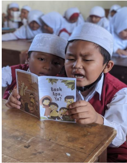
Gambar 2. Peserta didik sedang membaca buku