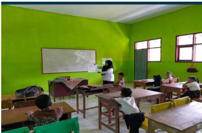
Gambar 1. Pelaksanaan GLS

Pihak sekolah mengapresiasi capaian literasi bagi peserta didik yang selalu aktif untuk membaca buku, membuat cerita pendek dan puisi. Hal ini bisa menciptakan kebiasaan literasi sekolah yang ditingkatkan dengan adanya penghargaan yang diberikan ketika upacara bendera. Prestasi yang di hargai tidak melulu pada bidang akademik melainkan sikap dan upaya peserta didik dalam meningkatkan semangat peserta didik belajar di sekolah juga.