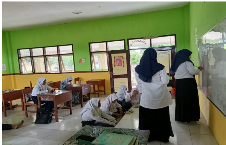
Gambar 3. Penjelasan tentang GLS