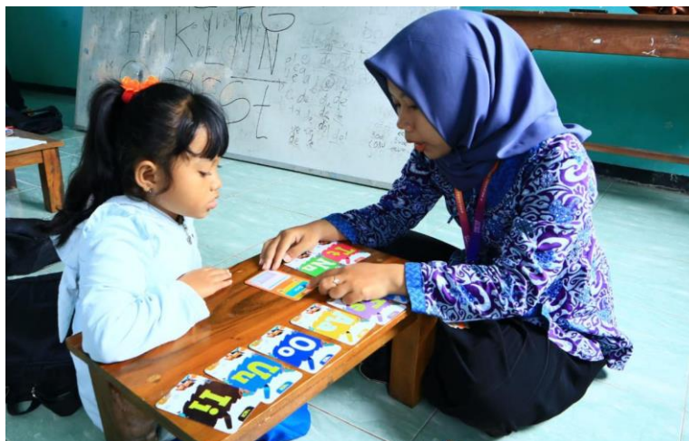
Gambar 4. Pelaksanaan GLS di sekolah