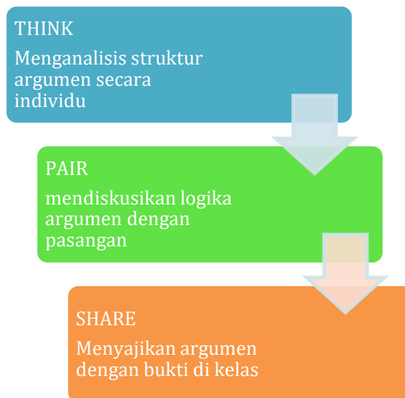
Gambar 2. Diagram Alur Tahapan TPS dalam Konteks Analisis Teks Argumentasi