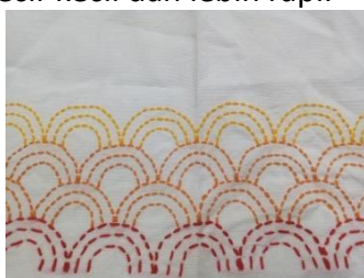
Gambar 3. Hasil berbagai jarak jahitan sulam

3. Pemilihan jarak jahitan sulaman Dalam penelitian ini peneliti mencoba menyulam dengan berbagai jarak jahitan setiap inci. Jahitan dengan jarak 4-5 buah setiap inci menghasilkan jahitan yang kurang bagus karena jarak jahitan terlalu jauh. Jahitan dengan 7-8 jahitan per-inci adalah yang paling baik karena jahitan yang lebih kecil-kecil dan lebih rapi.