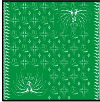
Gambar 4.5 motif tekstil (5) Hurip