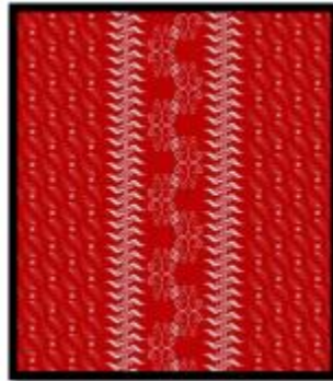
Gambar 4.1 motif tekstil (1) Lingkung Kerta

Batik Lingkung Kerta ini menggunakan kain dengan panjang 200 cm dan lebar 150 cm. posisi motif yang memanjang, menggunakan warna merah yang berasal dari warna yang terdapat pada logo kota Bogor yang memiliki makna penuh keberanian. Batik lingkung kerta ini menggunakan pola serak searah yang dipadukan dengan pola serak berlawanan yang di setiap motif dibatasi dengan kujang. Menggunakan ragam ornament geometris dan ornament organis tumbuhtumbuhan serta menggunakan pengulangan pola dimana-mana yaitu pengulangan suatu bentuk pola desain satu atau lebih untuk menutup atau mengisi sebuah permukaan agar terlihat seragam.