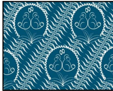
Gambar 4.4 motif tekstil (4) Bujangga

Batik bujangga ini menggunakan kain dengan panjang 200 cm dan lebar 150 cm dibuat dengan posisi melebar. Batik bujangga menggunakan warna identitas kota Depok yaitu biru keunguan yang memiliki makna keluasan wawasan dan kejernihan pikiran. Batik bujangga ini menggunakan ornament geometris lereng serta menggunakan pengulangan motif jenis Pengulangan linier, yaitu pengulangan suatu bentuk desain yang pasti dari garis.