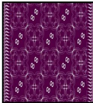
Gambar 4.2 motif tekstil (2) Mukti

Batik mukti ini menggunakan kain dengan panjang 200 cm dan lebar 150 cm dibuat dengan posisi memanjang. Batik mukti menggunakan warna identitas kabupaten Ciamis yaitu ungu yang memiliki makna kekayaan budhi. Batik mukti ini menggunakan ornament geometris meander atau hiasan pinggir yang bentuk dasarnya berupa garis berliku serta menggunakan pengulangan motif jenis Pengulangan formal, yaitu pengulangan dua bentuk desain yang sisinya sama dan serupa.