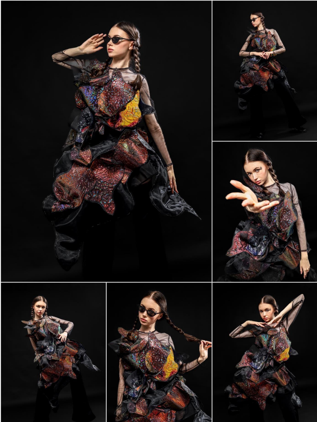
Gambar 4. Rancangan Artwear 1