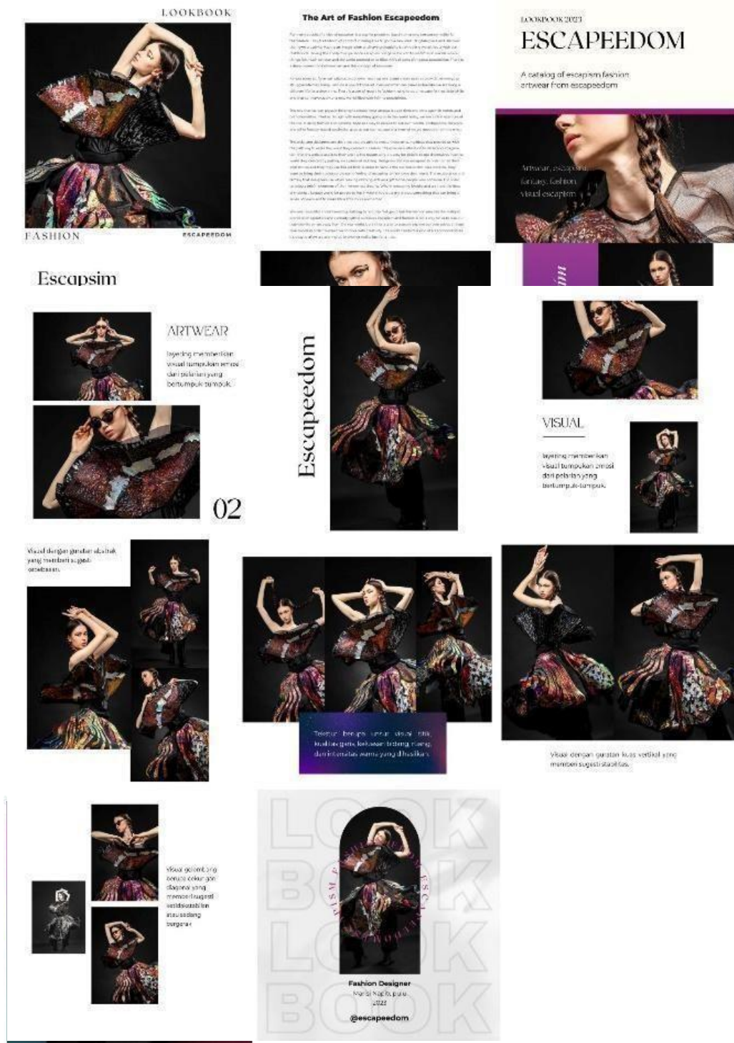
Gambar 2. Catalogue Escapeedom