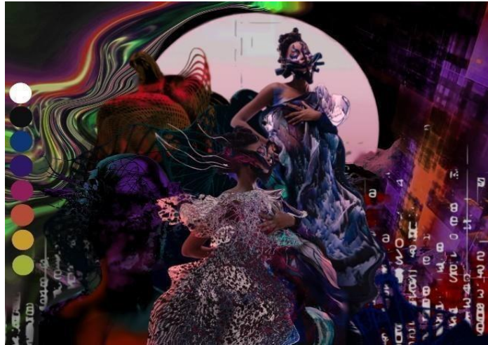
Gambar 1. Moodboard