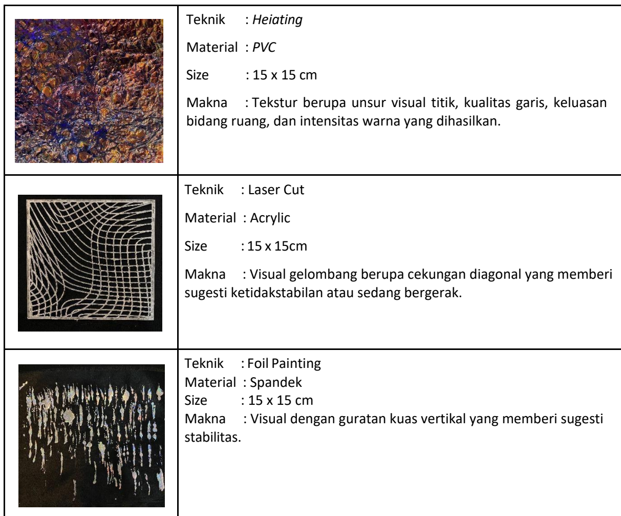
Tabel 2. Eksplorasi Bentuk Awal

Eksplorasi teknik awal penelitian ini berangkat dari bentuk awal dengan menggunakan teknik heating , layering , dan foil painting .