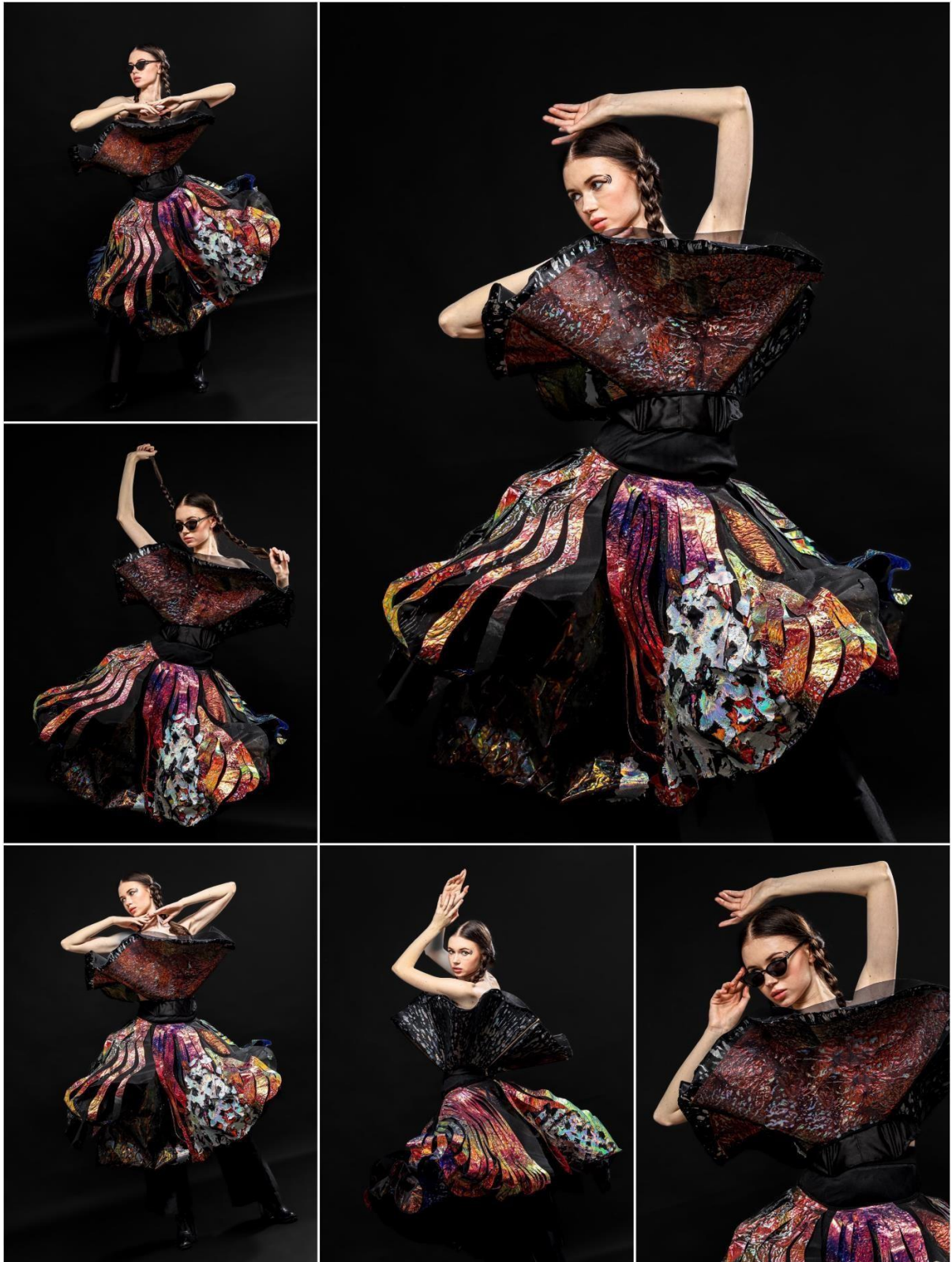
Gambar 5. Rancangan Artwear 2