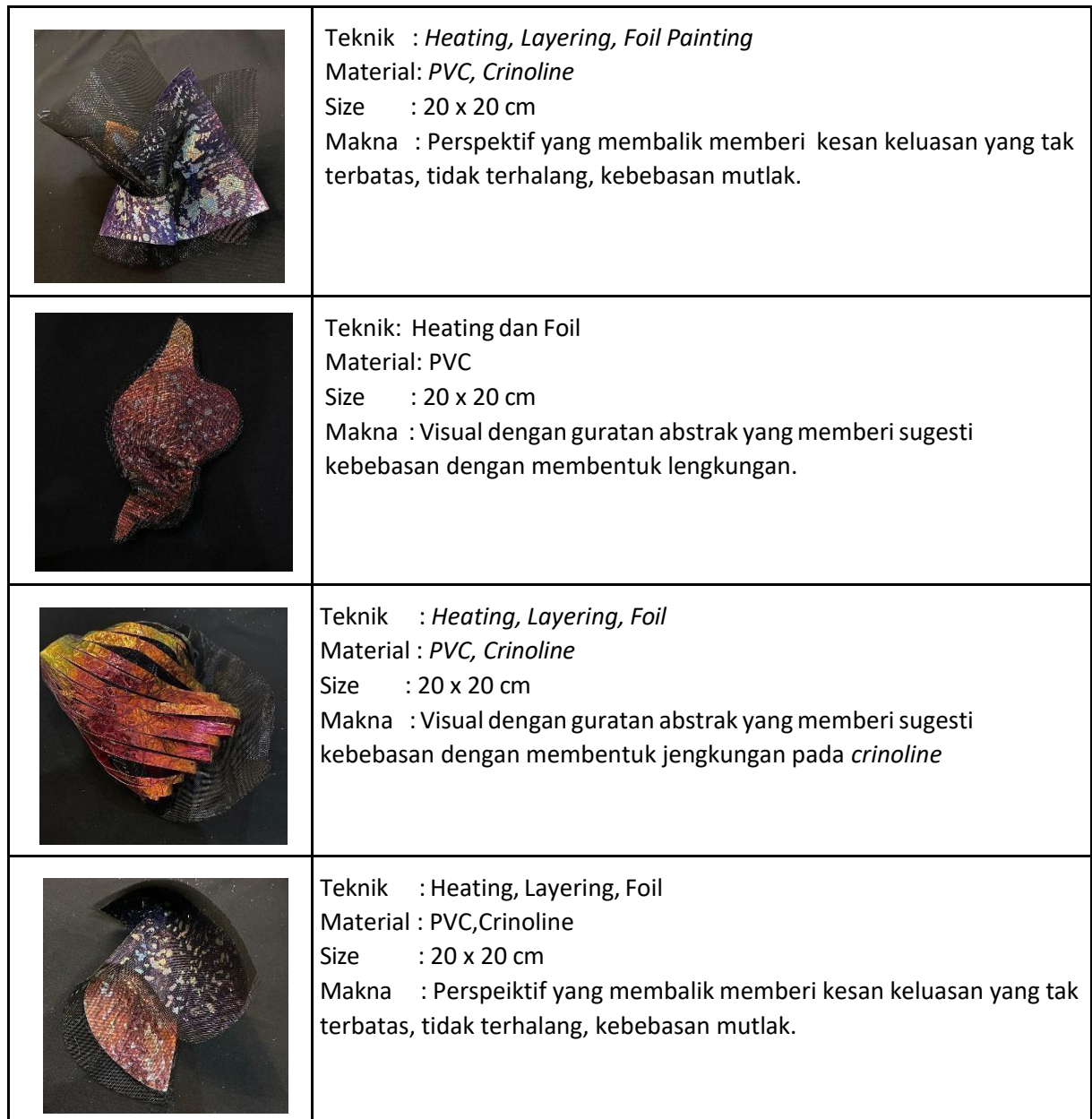
Tabel 3. Eksplorasi Lanjutan

Eksplorasi teknik awal penelitian ini dilanjutkan menjadi bentuk modul menggunakan teknik heating , layering , dan foil painting . Modul disusun sesuai bentuk visualisasi dari Escapism yang bertumpuk dan berulang-ulang/pengulangan.