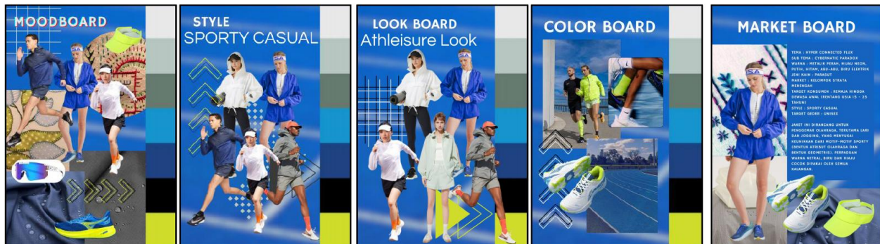
Gambar 1. Moodboard dan konsep desain

Penelitian ini bertujuan untuk mendeskripsikan penilaian estetika pada jaket thrifting dengan hiasan sulaman bebas. Tema dari koleksi busana jaket thrifting adalah "Athleisure Essentials" yang berarti barang-barang pokok atau penting yang berkaitan dengan Athleisure look. Athleisure look sendiri merupakan gaya busana yang menggabungkan pakaian olahraga dengan gaya kasual. Gaya athleisure sering dikenakan untuk aktivitas sehari-hari, namun tetap memiliki ciri khas kenyamanan dan fleksibilitas, bahan yang ringan dan memiliki sirkulasi udara yang baik, dan warna cerah atau netral. Selain itu, Athleisure Essentials juga menggambarkan Trend Forecasting 2025/2026 dengan tema Hyper Connected Flux dan sub-tema Cybernatic Paradox. Hasil produk jaket thrifting dengan hiasan sulaman bebas ini akan dinilai oleh 5 orang panelis ahli berdasarkan teori estetika menurut A.A.M. Djelantik yaitu aspek wujud atau rupa, aspek bobot atau isi, dan aspek penampilan atau penyajian.