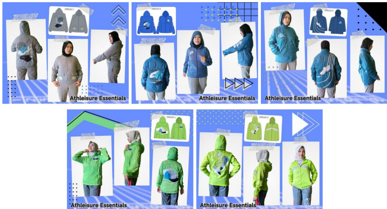
Gambar 3. Hasil produk jaket thrifting dengan hiasan sulaman bebas “Athleisure Essentials”

Hasil penilaian estetika produk jaket thrifting dengan sulaman bebas dinilai berdasarkan teori estetika menurut (Djelantik et al., 1999) pada aspek wujud atau rupa (sub indikator unsur dan prinsip desain), aspek bobot atau isi (sub indikator gagasan atau ide), dan aspek penyajian dan penampilan (sub indikator sarana atau media). Dibawah ini merupakan hasil akhir dari penilaian lima produk jaket thrifting dengan sulaman bebas, yaitu: