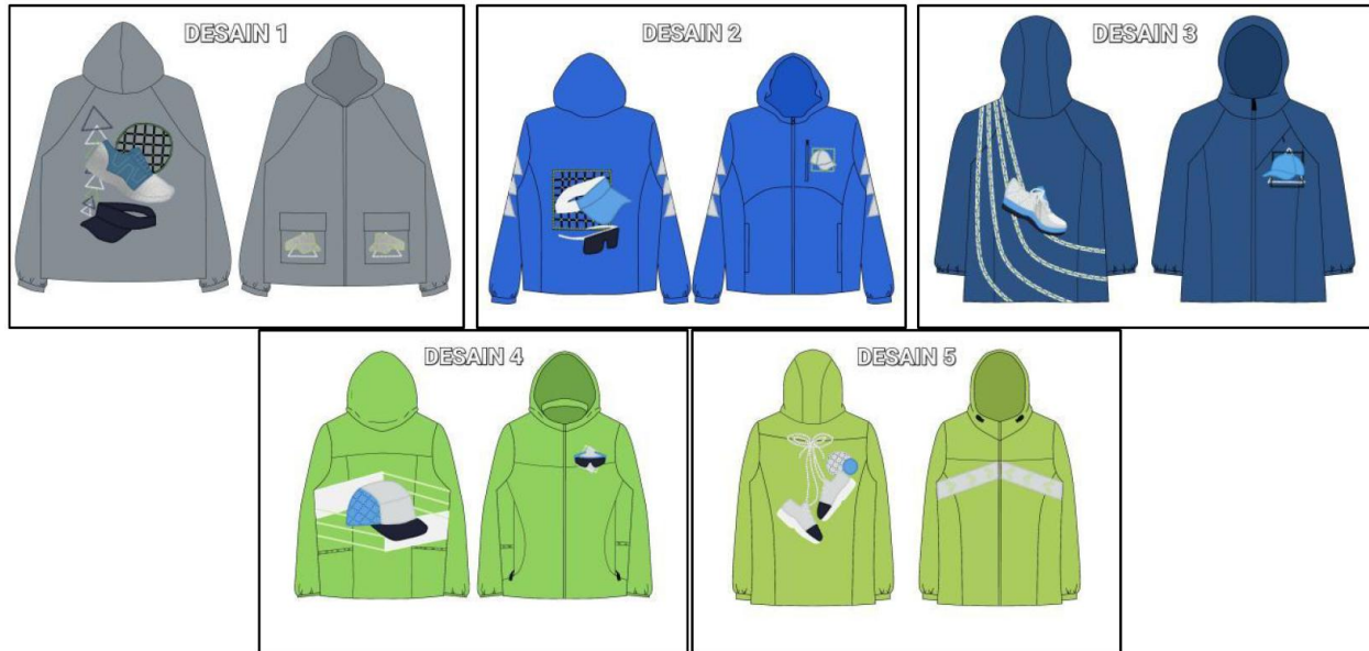
Gambar 2. Desain jaket thrifting dengan hiasan sulaman bebas