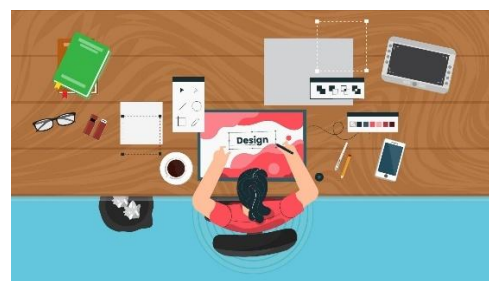
Gambar 4.4 Materi 4 Komponen Visual Design