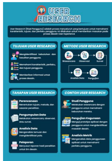
Gambar 4.7 Materi 7 Komponen User Research