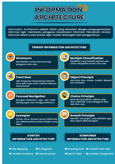
Gambar 4.5 Materi 5 Komponen Information Architecture