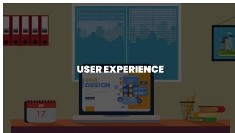
Gambar 4.1 Materi 1 Pengertian UX

Tahap pengemasan produk media pembelajaran yang telah dikembangkan untuk media video animasi motion graphics dikemas dalam format .mp4 berjumlah 4 video, dan media infografis dikemas dalam format .jpg berjumlah 3 gambar. Tampilan hasil akhir video animasi dan infografis terdapat pada gambar 4.1 hingga 4.7 berikut.