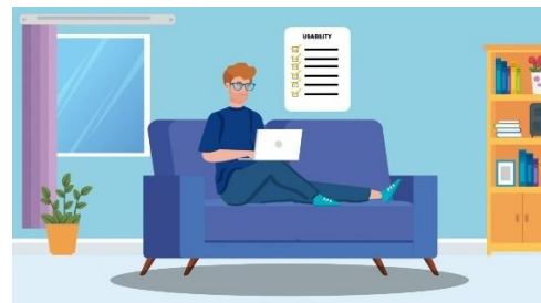
Gambar 4.2 Materi 2 Komponen Usability