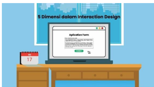
Gambar 4.3 Materi 3 Komponen Interaction Design