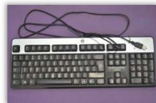
Gambar 4.2 Keyboard