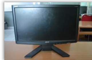
Gambar 4.1 Monitor