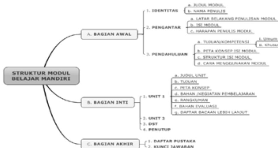
Gambar 3. Peta konsep penyajian modul

Adapun urutan penyajian modul terdiri dari tiga bagian yaitu Bagian Awal, Bagian Inti, dan Bagian Akhir. Pada bagian awal terdapat identitas, pengantar, dan pendahuluan modul. Pada bagian inti terdapat penjabaran materi di tiap unitnya. Pada bagian akhir, terdapat daftar pustaka dan kunci jawaban. Untuk lebih jelasnya dapat dilihat pada peta konsep penyajian modul pada Gambar 3.