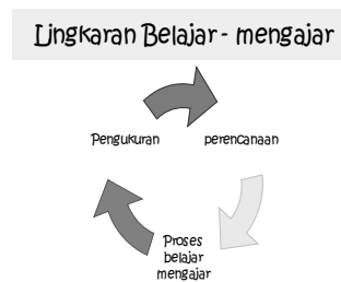
Gambar 1. Lingkaran belajar mengajar

Asesmen merupakan salah satu kegiatan dari 'lingkaran belajar mengajar', seperti yang dapat dilihat dari gambar berikut ini.