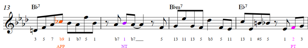
Gambar 8. Contoh Appoggiatura

Pada gambar dibawah ini, Fitzgerald juga menggunakan appoggiatura menggunakan nada b9 (Cb) dari akor Bb7. Nada tersebut melangkah naik dengan jarak nada tertis dari nada akor ke tujuh (Ab) dan diikuti dengan nada akor tonika (Bb) yang melangkah turun.