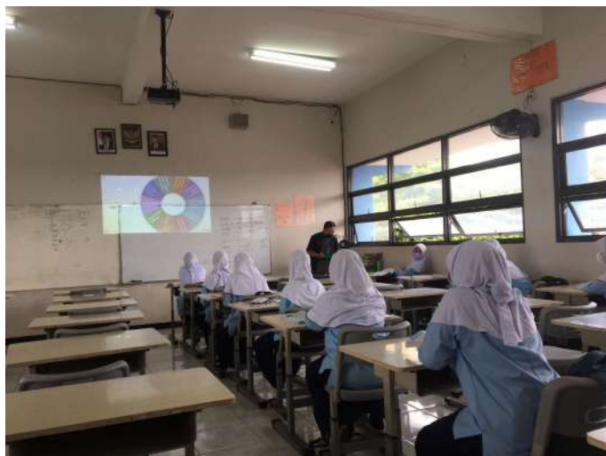
Gambar 02. Kegiatan mereview materi Sumber: Dokumentasi Ken Keffa Ellena, 4 Maret 2022

Lalu pada pertemuan kedua , guru mulai menjelaskan mengenai kegiatan pembelajaran tersebut berupa rencana untuk mengerjakan uji keterampilan yang diharapkan kepada peserta didik agar dapat mencapai kompetensi tersebut. Sebelum memasuki kegiatan pembelajaran, guru me-review kembali materi pembelajaran melalui beberapa pertanyaan mendasar. Pertanyaan yang dilontarkan kepada siswa merupakan pertanyaan seputar materi sebelumnya. Selain itu, guru juga memberikan pertanyaan mendasar seperti; 1) Pengertian lagu daerah, 2) Ciri-ciri lagu daerah, dan 3) Bagaimana cara menyanyikan lagu daerah secara unisono. Lalu, kegiatan pertama pada pertemuan kedua tersebut diawali dengan membagikan peserta didik menjadi beberapa kelompok. Pada pertemuan yang dilakukan pada tanggal 11 Maret 2022, telah dilakukan diskusi antara guru dengan siswa mengenai perencanaan rancangan proyek bernyanyi dan penyusunan jadwal aktivitas yang akan dikerjakan oleh siswa. Guru memberikan lagu daerah yang berasal dari Jawa Tengah, yaitu Suwe Ora Jamu , sebagai materi lagu yang akan dikerjakan bersama kelompoknya masing-masing. Untuk jadwal aktivitas latihan dihitung mulai hari ini hingga 2 minggu ke depan.