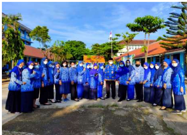
Gambar 01. Guru SMPN 281 Jakarta (Dokumentasi Ken Keffa Ellena, 2022)

juga siswa yang menganut agama Kristen dengan total siswa 47 orang, agama Katholik dengan total 7 orang, dan agama Hindu dengan total paling sedikit 1 orang. Rentang umur murid di SMP tersebut berkisar dari umur 13 – 15 tahun. Tidak menutup kemungkinan, ada murid yang umurnya di bawah 13 tahun dan bahkan terdapat juga murid yang umurnya di atas 15 tahun.