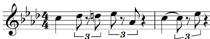
Gambar 2. Cara Menyanyikan Ritmik Not Seperdelapan Pada Gambar 4.5 Dengan Swing Feel

maka, cara menyanyikannya seperti pada gambar di bawah ini: