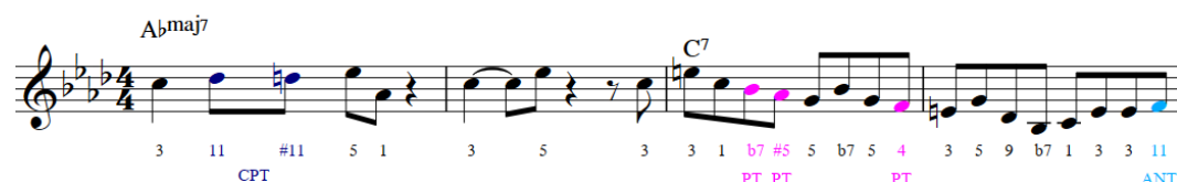
Gambar 7. Contoh Chromatic Passing Tones, Passing Tones & Anticipation Tones

Dalam scat singing -nya Fitzgerald juga menggunakan non harmonic tones yaitu nada-nada diluar nada akor. Contohnya adalah, pada gambar dibawah ini, ia menggunakan beberapa not lintas atau passing tones (PT). Dalam akor A♭maj7 pada birama 1 – 2 (gambar 7), Fitzgerald menggunakan not lintas dengan pendekatan kromatis ( chromatic approach ). Selain itu ia juga menggunakan anticipation tones (ANT) untuk menuju ke birama selanjutnya.