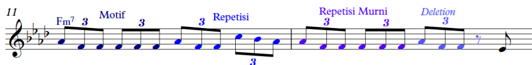
Gambar 4. Periode A, Birama 11 – 12

Pada birama 11, terdapat repetisi ritmik, kemudian repetisi ritmik yang dikombinasikan dengan triplet. Kemudian pada birama 12 (ketukan 3-4) terdapat repetisi murni dari motif pada birama 11(1-2). Selain itu ditemukan jenis motivic development lainnya yaitu deletion , yang berarti mengurangi atau menghilangkan nada dari motif orisinalnya.