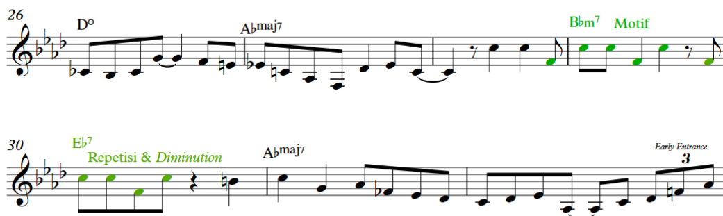
Gambar 6 Periode B, birama 26-32

Pada gambar 4.6, Fitzgerald menggunakan motif melodis dan ritmik yang dikembangkan menggunakan repetisi dan diminution . Diminution dapat terlihat dari pengurangan durasi pada nada F dan C yang semula bernilai satu ketuk menjadi bernilai ½ ketuk.