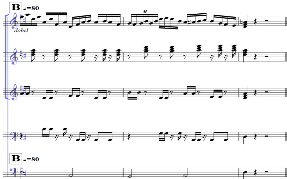
Notasi 8: Pola ritme variasi keroncong (dobel).

Di dalam irama dobel permainan pola ritme ini dirapatkan, yang dalam musik keroncong digunakan untuk menambah spirit dalam permainan keroncong dan menghidupkan lagu yang sedang dibawakan.