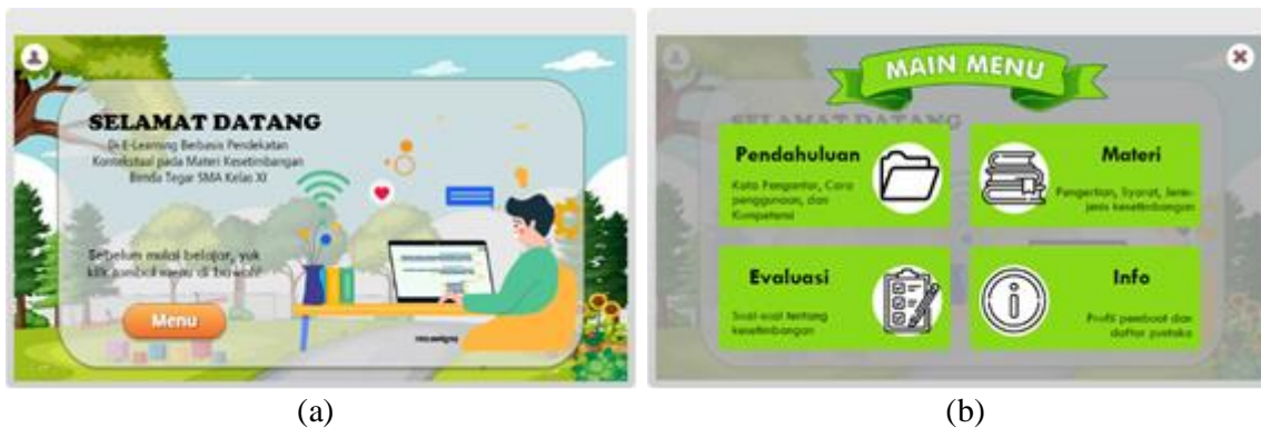
GAMBAR 2. (a). Pembuka, (b). Pop Up Menu

GAMBAR 2(a) adalah cover atau tampilan awal dari e-learning . Jika peserta didik mengklik tombol “START” maka akan muncul tampilan seperti GAMBAR 2(b), lalu peserta didik diminta untuk mengisi nama dan asal sekolah.