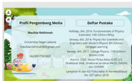
GAMBAR 6. Tampilan info

Selanjutnya menu evaluasi. Menu evaluasi ini berisi soal-soal mengenai kesetimbangan benda tegar yang terdiri dari 5 soal. Diakhir sesi evaluasi terdapat hasil seperti GAMBAR 6(b). Dari hasil tersebut, peserta didik dapat mengevaluasi sejauh mana pemahamannya terkait materi kesetimbangan benda tegar berdasarkan nilai yang telah diperoleh. Peserta didik juga dapat mengulanginya atau me-review kembali soal-soalnya. Dan tampilan terakhir dari e-learning ini adalah tampilan info seperti pada GAMBAR 7. Pada tampilan ini, terdapat informasi mengenai profil pengembang media dan daftar pustaka yang digunakan pengembang dalam mengembangkan e-learning tersebut.