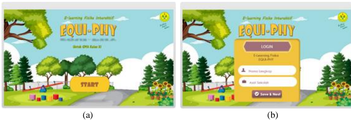
GAMBAR 2. (a). Cover e-learning , (b). Tampilan login

Produk yang dihasilkan pada penelitian ini berupa e-learning berbasis pendekatan kontekstual berbantuan articulate storyline pada materi kesetimbangan benda tegar. Pengembangan e-learning ini menggunakan model ADDIE. Penelitian pengembangan model ADDIE yang dilakukan hanya sampai tahap Design, karena terbatasnya waktu dan data. Tahap awal penelitian yaitu tahap Analysis, pada tahap ini peneliti melakukan analisis kebutuhan dengan wawancara oleh guru SMA dan menyebar angket kepada peserta didik. Selanjutnya masuk ke tahap Design, pada tahap ini peneliti mulai merancang e-learning fisika. Berikut tampilan e-learning yang telah selesai dirancang: