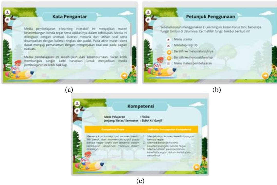
GAMBAR 3. (a). Kata Pengantar, (b). Petunjuk Penggunaan, (c). Kompetensi

terlebih dahulu. Pada pop up menu terdapat beberapa pilihan yaitu ada pendahuluan, materi, evaluasi dan info.