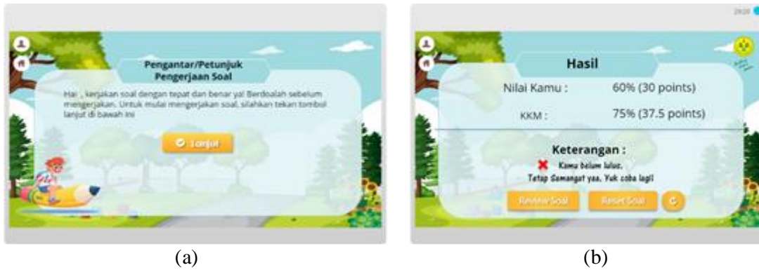
GAMBAR 5. (a). Tampilan awal evaluasi, (b). Tampilan hasil evaluasi

Selanjutnya menu evaluasi. Menu evaluasi ini berisi soal-soal mengenai kesetimbangan benda tegar yang terdiri dari 5 soal. Diakhir sesi evaluasi terdapat hasil seperti GAMBAR 6(b). Dari hasil tersebut, peserta didik dapat mengevaluasi sejauh mana pemahamannya terkait materi kesetimbangan benda tegar berdasarkan nilai yang telah diperoleh. Peserta didik juga dapat mengulanginya atau me-review kembali soal-soalnya. Dan tampilan terakhir dari e-learning ini adalah tampilan info seperti pada GAMBAR 7. Pada tampilan ini, terdapat informasi mengenai profil pengembang media dan daftar pustaka yang digunakan pengembang dalam mengembangkan e-learning tersebut.