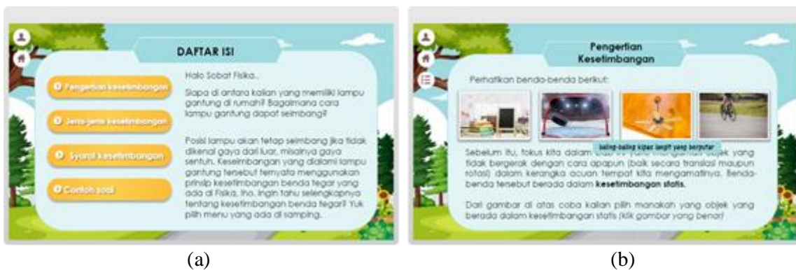
GAMBAR 4. (a). Daftar isi materi, (b). Tampilan salah satu sub materi

Pada menu pendahuluan terdiri dari kata pengantar, petunjuk penggunaan e-learning yang menjelaskan fungsi dari tools yang ada dan kompetensi yang akan dibahas pada e-learning seperti pada GAMBAR 4 diatas.